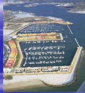
Marina de Portimao en Algarve