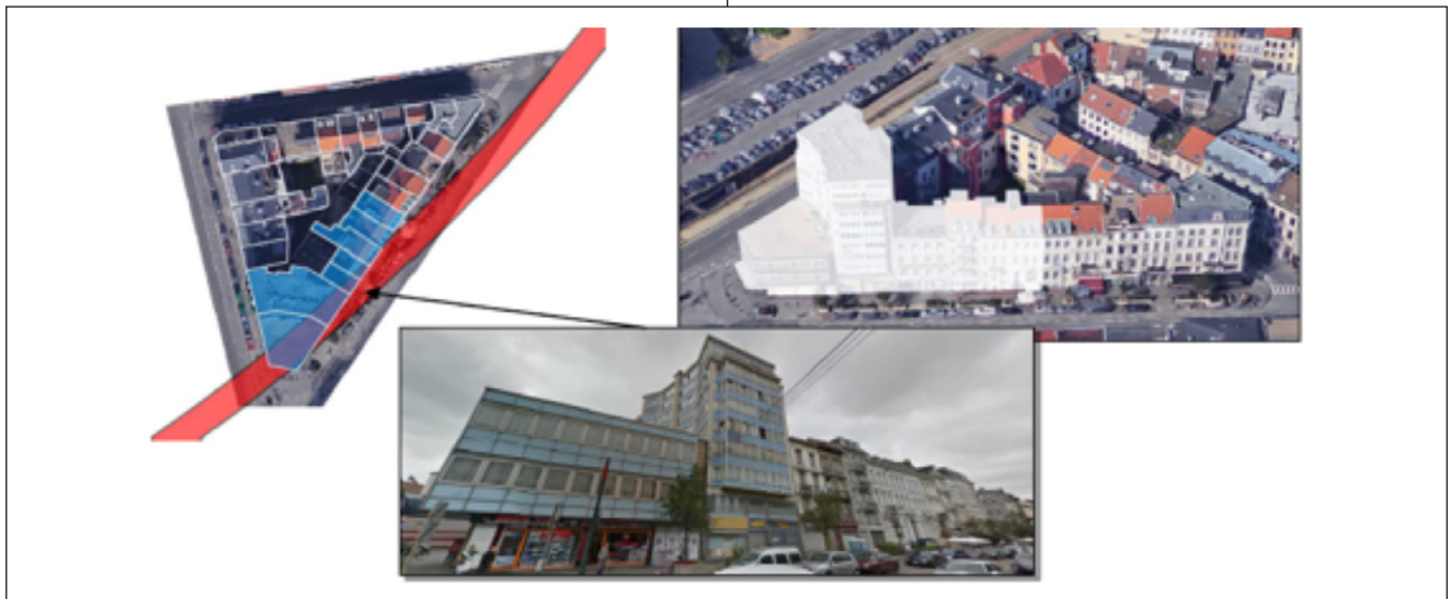
Figuur 79 : Illustratie van het tracé van de metro's en de gevels van de percelen die worden doorgestoken

L'îlot délimité par les axes Lemonnier – Midi – Woeringen est également impacté par la réalisation du tunnel qui, pour des raisons de rayon de courbure, doit rogner sur une partie de l'îlot (5 bâtiments donnant sur le boulevard Lemonnier ainsi que l'immeuble d'angle donnant accès à la station Lemonnier).