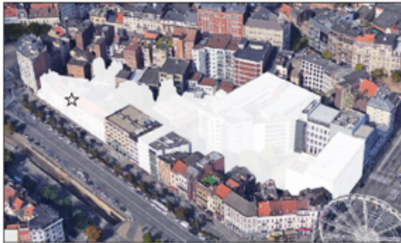
Figuur 80 : Weergave van de getroffen gebouwen

Het bouwblok tussen de assen Lemonnier - Zuid - Woeringen ondervindt eveneens een impact van de bouw van de tunnel die, wegens de bochtstraal, een deel van het bouwblok wegvreest (5 gebouwen die uitgeven op de Lemonnierlaan alsook het hoekgebouw dat toegang geeft tot het station Lemonnier).