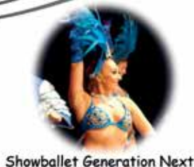
Showballet Generation Next