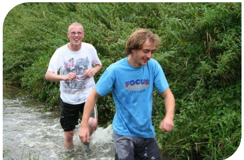
Onze oud-leiderstrophy 2006

Ons hoogtepunt is het weekend in het najaar, enkel voor oud-leiders. Door het