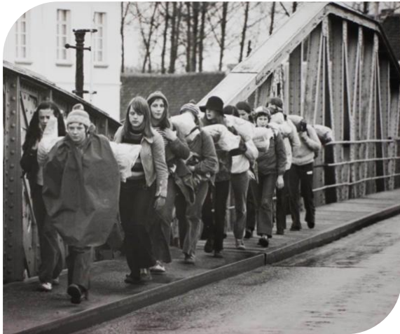
Joepie 19 op weg naar Dendermonde