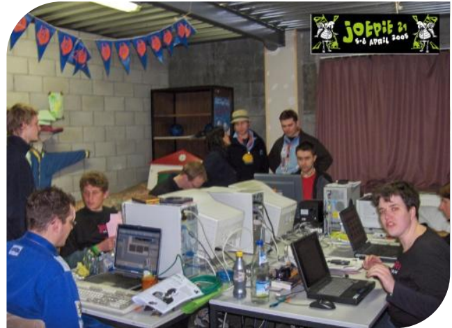
Achter de schermen van Joepie 21