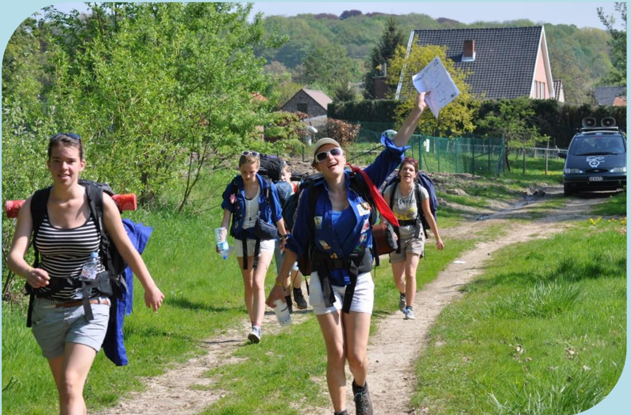
Op weg naar X, Joepie 24, april 2011.