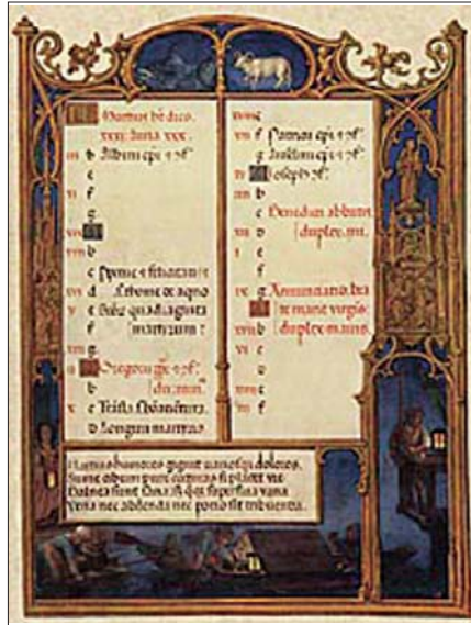
L'enluminure du texte concernant le mois de mars, toujours dans le bréviaire Grimani, représente, en haut, les signes du zodiaque du mois, soit le poisson et le bélier et, en bas, une scène de pêche nocturne à la lumière d'une bougie.