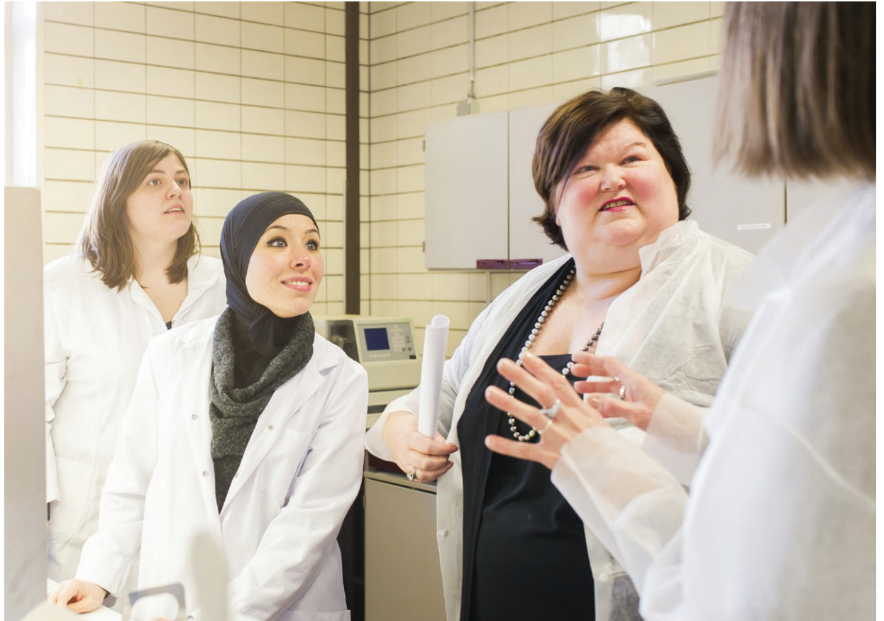
Maggie De Block op bezoek in een labo van het Wetenschappelijk Instituut Volksgezondheid in Elsene.

Op voorstel van Maggie De Block, minister van Sociale Zaken en Volksgezondheid, heeft de ministerraad een pakket maatregelen goedgekeurd waaronder de opheffing van ereloon-supplementen die specialisten vragen aan patiënten die in daghospitalisatie in een twee- of meerpersoonskamer verblijven. Patiënten krijgen vanaf 1 juli 2015 in bepaalde situaties ook duidelijker informatie over het bedrag dat zij betalen voor verstrekte zorgen.