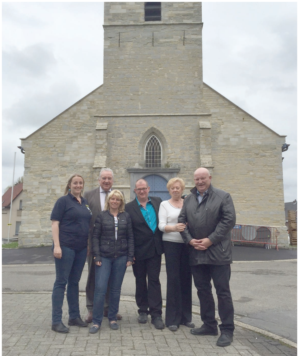
Het dorpsplein van Mazenzele zal een nieuw uitzicht krijgen.

Momenteel beschikt Mazenzele over twee feestzalen: de gemeentelijke St.Pieterszaal aan de Steenweg achter het oud gemeentehuis van Mazenzele, en zaal Houtekeet, eigendom van de kerkelijke overheid. De ligging van de eerste zaal, aan een drukke gewestweg, is niet optimaal. Zowel voor veiligheid, als door een gebrek aan parkeerruimte, is een nieuwe locatie aangewezen. De tweede zaal is beter gelegen maar verkeert in een zodanig slechte toestand dat ze moet afgebroken worden. (Lees meer op p.3)