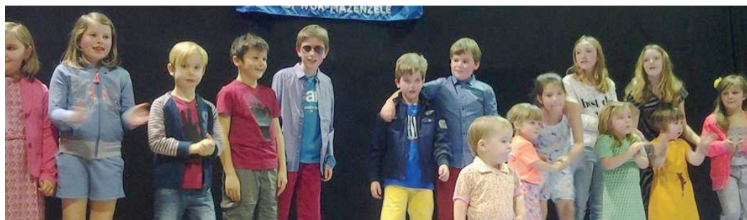
Modeshow, ook de allerkleinsten mochten mee op de catwalk.

De eerste activiteit van 2015 van de Liberale Vrouwen Opwijk-Mazenzele heeft intussen al naam en faam gekregen. De twejaarlijkse modeshow die plaatsvond op 8 februari kreeg 130 kijkklustigen over de vloer. Er werd kinderkledij van "Jules&Julie" en dameskledij van "Life Style" geshowd. Aan de voeten van de modellen waren de schoenen van FM Shoe te bewonderen. Ook de allerkleinsten mochten mee op de catwalk.