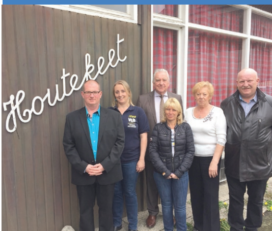
De zaal Houtekeet is aan vernieuwing toe.