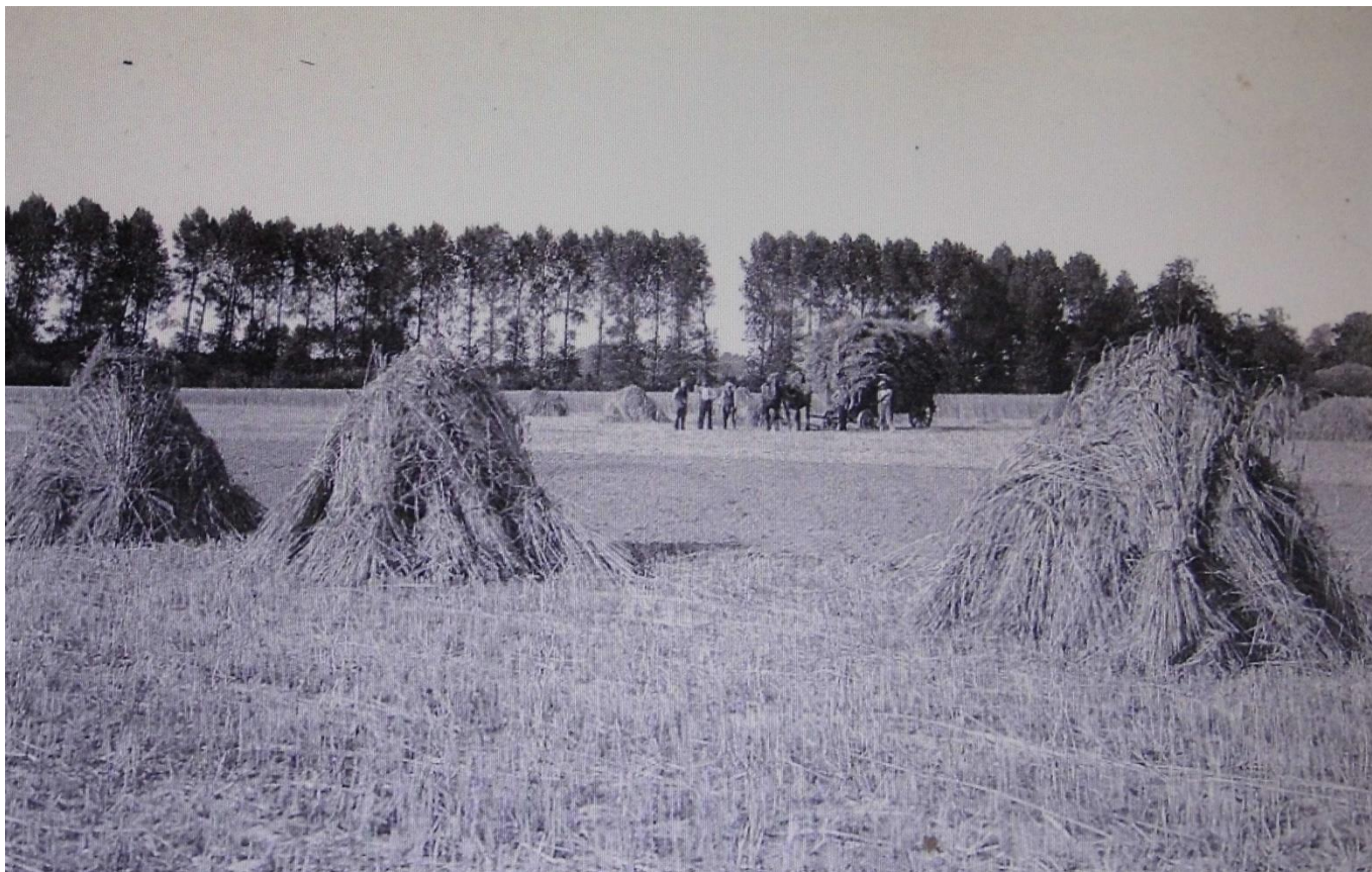
Een liefelijk tafereel in vredestijd: boeren van het Kattenhuis verzamelen het stro op de velden aan de Boechoutsberg te Epegem.