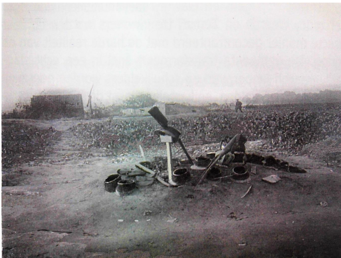
Noodgraf van een Belgische soldaat in Groot-Zemst in 1914.