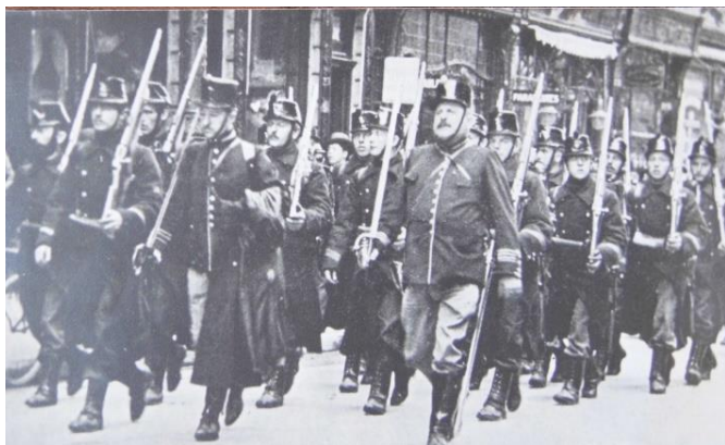
Optocht van de burgerwacht in haar vooroorlogse kledij.