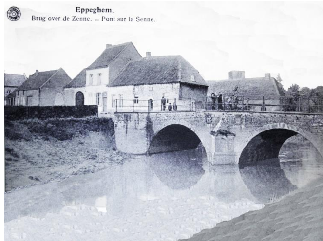
De brug van Eppegem tijdens de oorlog. Let op de kerk zonder spits op de achtergrond.

De brug van Eppegem zelf, waar de N1 de Zenne kruist,