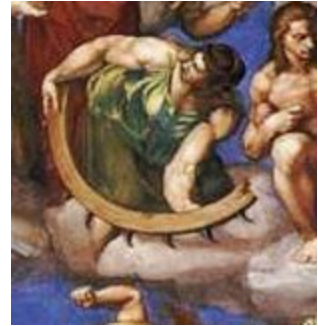
Catharina met gebroken rad, metafoor voor haar dood

Om ons te overtuigen, heeft Michelangelo veel gebruik gemaakt van retorische stijlmiddelen . Zo bevat het schilderij veel metaforen : de voorwerpen van de heiligen, die staan voor de oorzaak van hun dood en deze zijn dus de reden waarom zij zich in de hemel bevinden. Enkele voorbeelden hiervan zijn: het gebroken rad van Catharina (Discoveryourmission.nl, 2017), de zaag van Simon (Petrus Bandenkerk Venray, 2017) en de pijlen van Sebastiaan (Heiligen.net, 2014). Maar ook de handbeweging van Christus, die staat voor de kanten waar de herrezenen naartoe gestuurd worden (Khan Academy, 2015) en de slang, die staat voor Minos, de rechter in de onderwereld (infonu.nl, 2017), zijn voorbeelden van metaforen in het schilderij.