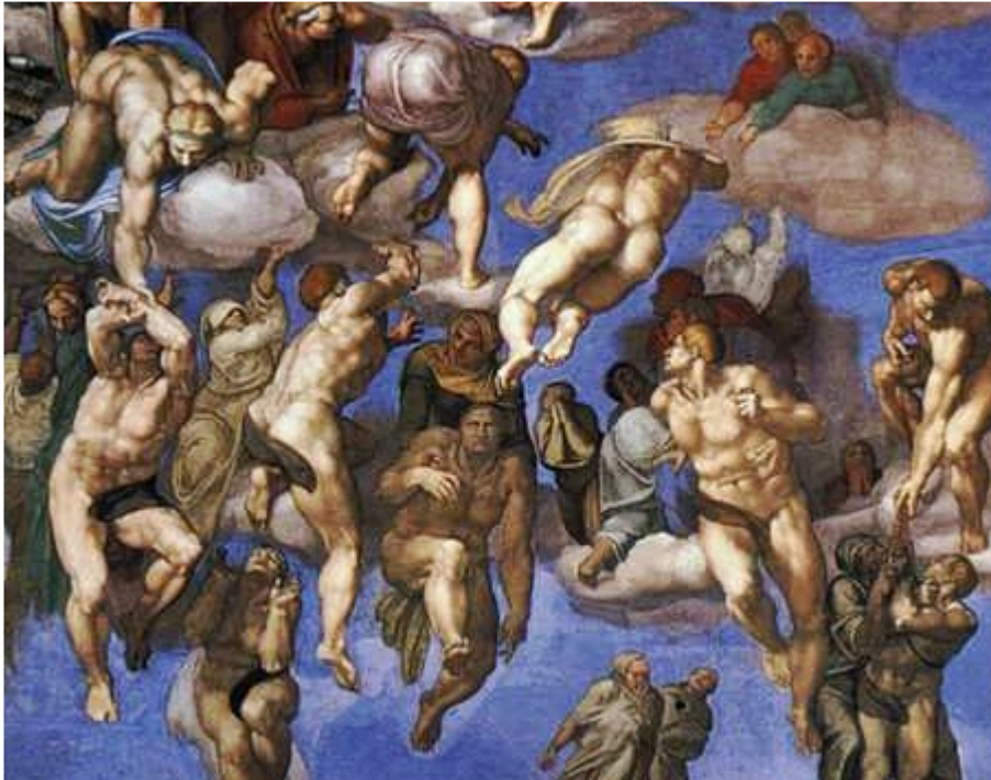
De engelen die de uitverkorenen de hemel intrekken zijn de helpers.

De karakters vallen onder de karakertypen van Propp , gezien ze geen duidelijke ontwikkeling maken in het verhaal. De meesten representeren bepaalde karaktereigenschappen, waar we later nog op in gaan. Volgens de typen van Propp zouden de uitverkorenen de held zijn, zij gaan immers op reis naar de hemel. Hier tegenover staan de valse helden , namelijk de gedoemden, die ook in de hemel willen komen, terwijl zij zich misdragen hebben. De engelen met trompet zijn zenders , zij sturen de herrezenen op pad naar de gezochte : een plekje in de hemel (Khan Academy, 2015). De schenker is Jezus: hij test de herrezenen en deelt hen een plek toe. Hierbij worden de uitverkorenen geholpen door de helpers : engelen die ze de hemel intrekken.