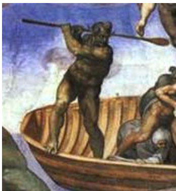
Charon is de tritagonist.

Toen we startten met deze analyse hadden wij eigenlijk meteen een dilemma: wij moesten bepalen om wie het verhaal nou echt draait, ofwel de protagonist . Jezus staat immers in het schilderij op een hele centrale plek, waardoor we neigden hem de protagonist te noemen. Maar we bedachten ons, omdat we toch meer van mening zijn dat de herrezene in het verhaal die rol vervult. Deze legt immers het avontuur af, waarbij Jezus eerder de antagonisten rol vertegenwoordigt: deze staat tegenover de wens van de herrezene en beoordeelt of deze wel of niet vervuld zal worden.