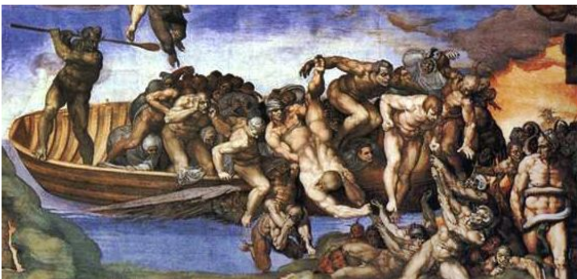
De hemel, blauw en licht; is boven, de hel, donker; is beneden.