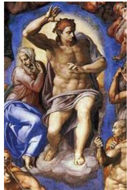
Jezus vervult de rol van antagonist.

De engelen en charon (in de boot) vervullen de rol van tritagonist : zij helpen bij het uitvoeren van het oordeel van Jezus.