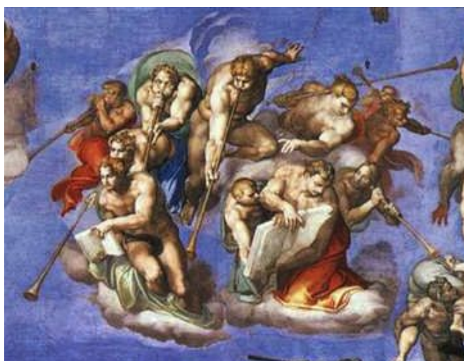
Het motorisch moment

Om het verhaal te kunnen begrijpen, kijken we naar de opbouw van het verhaal. Het schilderij is een afbeelding, waarbij het verhaal in volle gang is: het begint dus in medias res . De expositie wordt niet letterlijk verteld, maar valt af te leiden uit de indeling van het schilderij. Ieder deel van het verhaal heeft z'n eigen plek op het schilderij en wordt gestart door de engelen die de doden tot leven wekken met hun trompet: het motorisch moment .