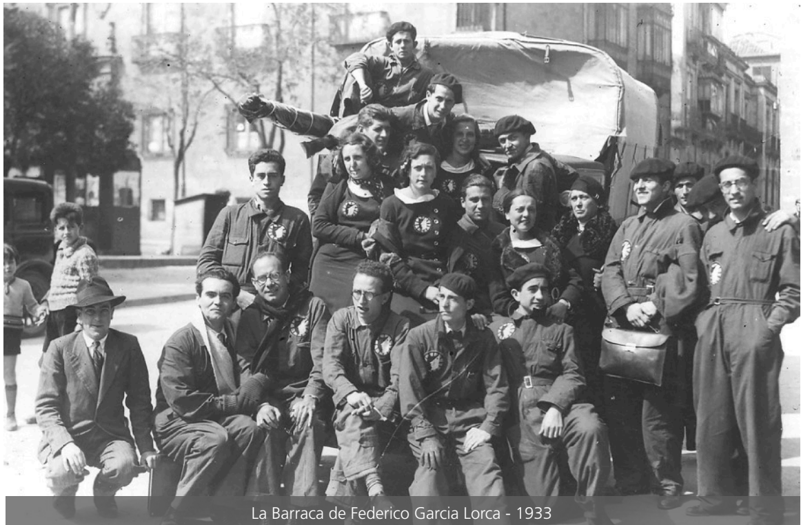
La Barraca de Federico García Lorca - 1933