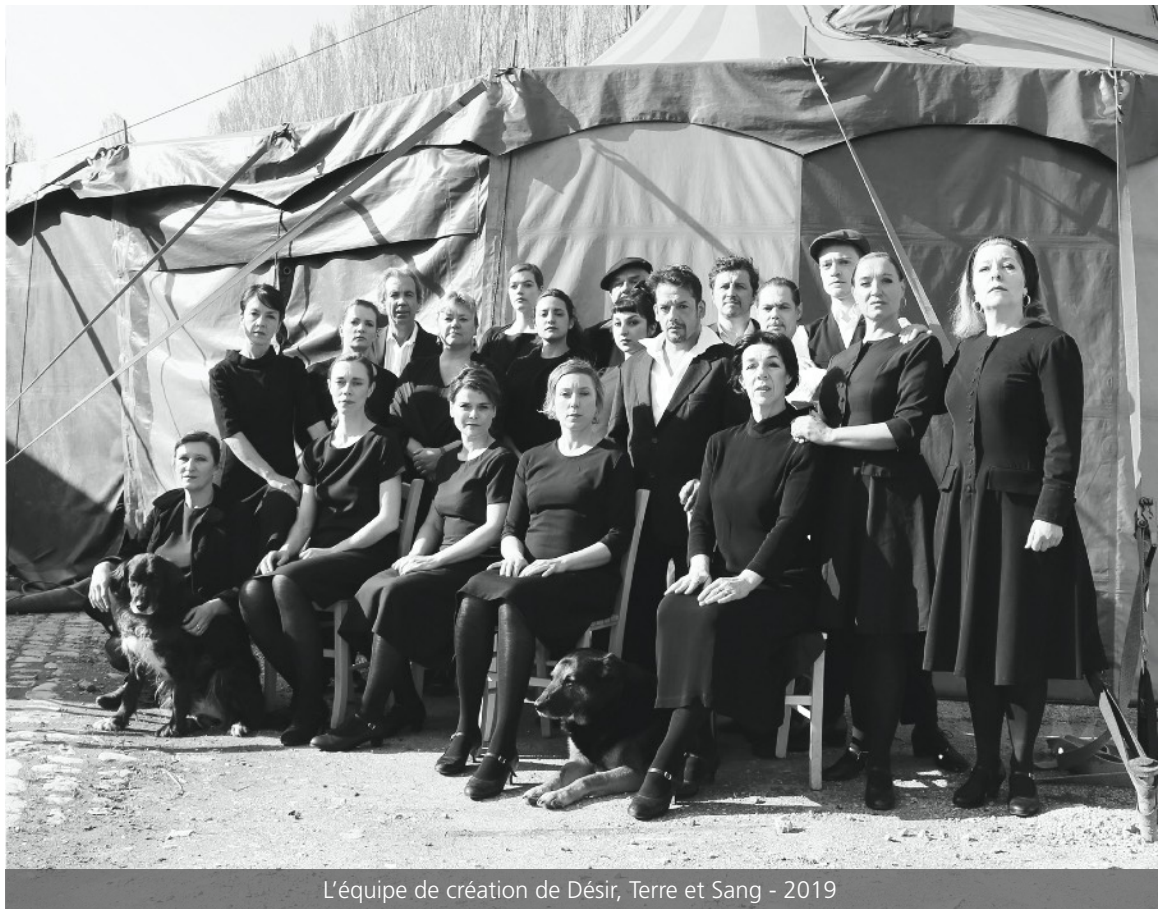
L'équipe de création de Désir, Terre et Sang - 2019