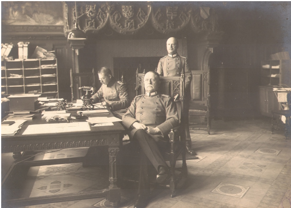
Afbeelding 1: Kommandant Günther in de schepenzaal van het Kortrijkse stadhuis

Na Von dem Knesebeck was Oberstleutnant Günther de bewindvoerder in de Kortrijkse Etappen-Kommandantur . Op 4 augustus 1916 werd hij naar Wervik overgeplaatst.