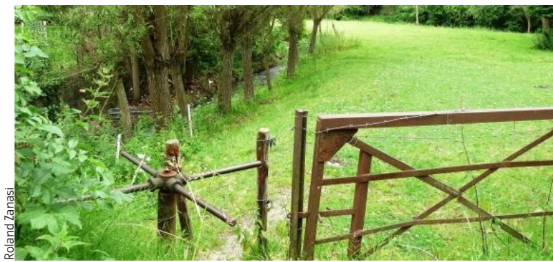
Le sentier Grand Pré, à Lasne, est l'une des balades proposées dans la région.

Genappe est la commune la plus étendue du Brabant wallon et abrite le « chemin de Saint-Jacques » sur son territoire. La commune a su préserver ses espaces verts et son caractère es-