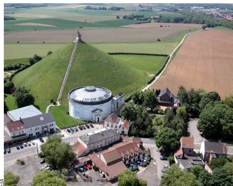
La Butte du Lion est un incontournable du site, qui s'étend sur plusieurs hectares.

Face à la Maison du Tourisme, au centre-ville, le Musée Wellington est l'ancien quartier général du duc anglais, il y séjourna les 17 et 18 juin 1815. Tactique, diplomatie et stratégie au menu du jour. Wellington y écrira la dépêche de la victoire. Une salle détaille les phases de l'affrontement. « La Suffisante », canon tirant des balles de 6 livres pris sur le champ de bataille, y trône avec... suf-