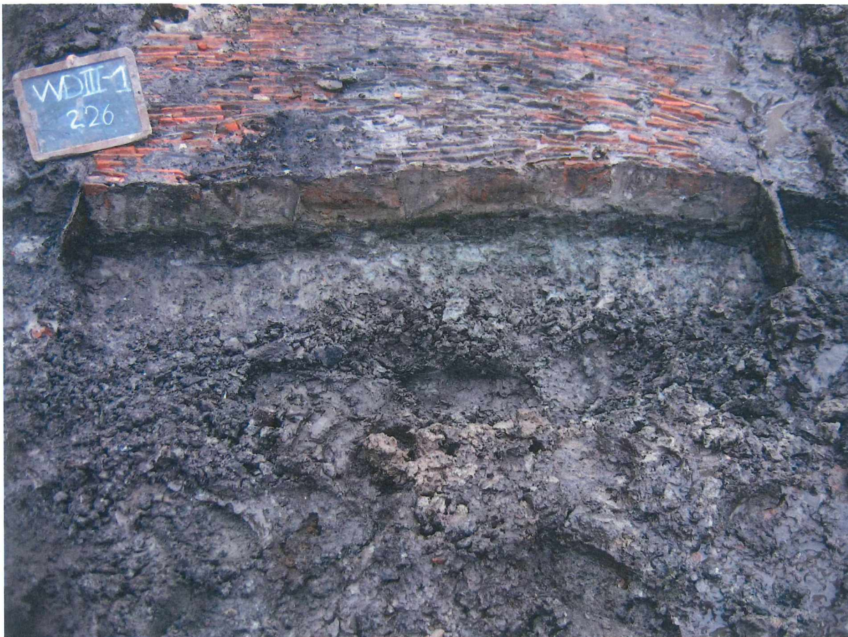
Figuur 6 Opbouw van de haardvloer

De haardvloer was gedeeltelijk verstoord, maar moet oorspronkelijk 1,40 m breed en meer dan 1,60 m lang geweest zijn. De vloer bestond uit verticaal geplaatste dakpannen en fragmenten van dakpannen. De dakpannen waren in een zandbed gezet, bijengehouden door een houten raamwerk. Een plaatselijke, grijze verkleuring op de bovenrand van een aantal dakpannen, toont aan waar het vuur werd gestookt. Deze haardvloer is tot nog toe de enigste die op de site Verversdijk werd aangetroffen.