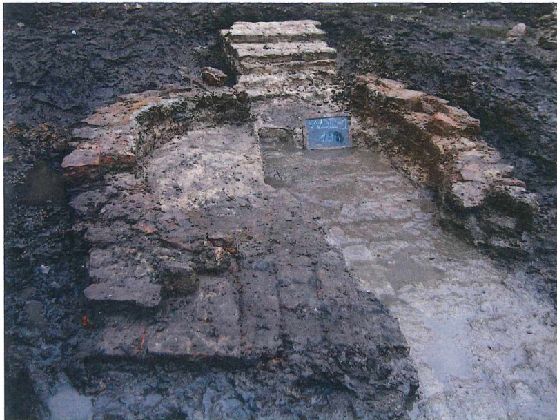
Figuur 8 Verversstookplaats

Bij de opgravingen die in 2003 plaatsvonden op de site Verversdijk werden enkele stookplaatsen aangetroffen die met de ververs in verband gebracht kunnen worden. Het gaat om ovale of sleutelgatvormige bakstenen constructies. Steeds is een gedeelte