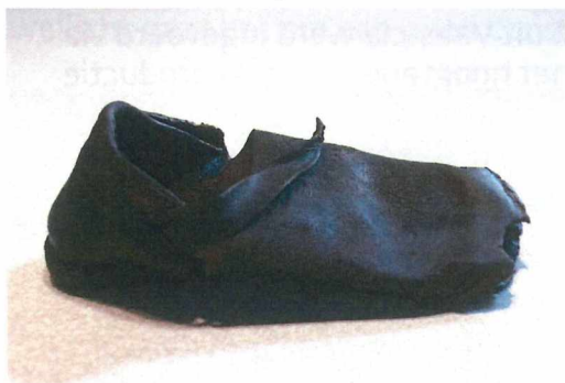
Figuur 9 Kinderschoentje

Een bijzondere vondst uit de grote bakstenen put is een bijna gaaf lederen kinderschoentje. Het behoort tot het type schoenen met vaste gesp. Deze was oorspronkelijk op de zijkant van de schoen bevestigd, maar is niet bewaard. Over de voet heen liep een lederen riempje dat met de gesp werd vastgemaakt. Het schoentje heeft een dubbele lederen zool en kan gedateerd worden in de 16de eeuw. In vergelijking met onze moderne schoenen zou het met een maatje 25 overeenstemmen.