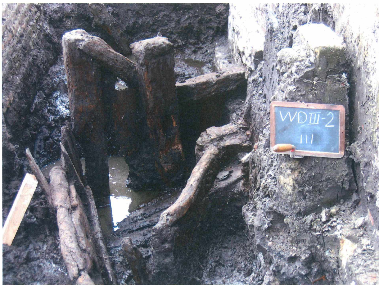
Figuur 12 Zicht op de houtconstructie

Een van de zware balken vertoonde sporen van oudere horizontale pen-gatverbindingen en schuine schoorverbindingen. Het gaat wellicht om een hoekstijl van een vrij imposant gebouw. Er werden geen sporen van vakwerk aangetroffen, dus wellicht gaat het om een open constructie of een beplankte gevel.