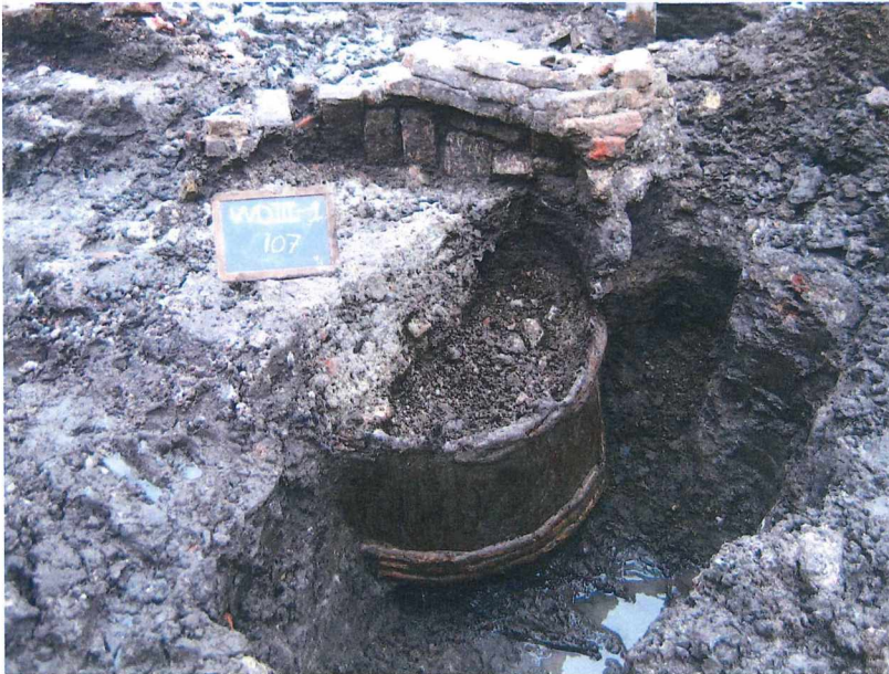
Figuur 5 Voorbeeld van een houten kuip

Bij de opgravingen kwamen verschillende houten structuren aan het licht. Er zijn enkele vierkante of rechthoekige bakken, maar ook ronde kuipen, die vermoedelijk in verband te brengen zijn met de verversactiviteiten. Eén van de ronde kuipen had een bakstenen bovenbouw. De duigen en hoepels waren bewaard, maar de bodem was - merkwaardig genoeg - verdwenen. Naast deze kuip, en er gedeeltelijk door