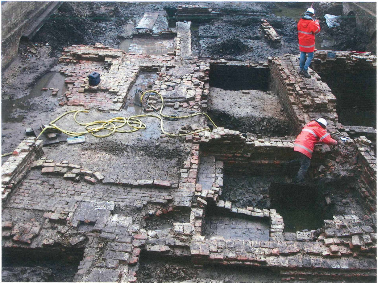
Figuur 2 Archeologen aan het werk

bouwactiviteiten; de 19de-eeuwse gebouwen die hier stonden werden immers nooit onderkeldert. Afgaande op de unieke resultaten van het voorgaand onderzoek, waren de verwachtingen dan ook hoog gespannen.