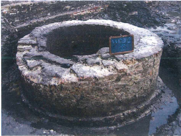
Figuur 7 Stenen waterfontein

naar het noorden, in de richting van de muren van het Hof van Mouscron zelf. Een tweede lezing van het bronnenmateriaal bracht de oplossing. Het Hof van Mouscron had inderdaad een eigen aftakking van de moederfontein, die uitkwam in de keukens en in het bleekhof. Vanuit de leiding naar het Hof van Mouscron ontsprong echter nog een verdere aftakking richting het huis van Jan de Wyndt aan de Kandelaarstraat. Deze aftakking bleek wel degelijk in een stenen fontein uit te monden, en ongetwijfeld gaat het om de fontein die bij de opgravingen aan het licht kwam.