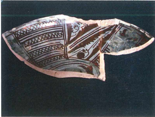
Figuur 11. Kom in Valentiaanse lusterwaar

(Spanje). De kom is aan weerszijden bedekt met wit tinglazuur, waarop aan de binnenzijde afwisselend zones met geometrische en plantaardige motieven zijn aangebracht. De versiering is uitsluitend uitgevoerd in goudkleur. Aan de buitenzijde van de kom zijn concentrische cirkels merkbaar, eveneens in goudkleur.