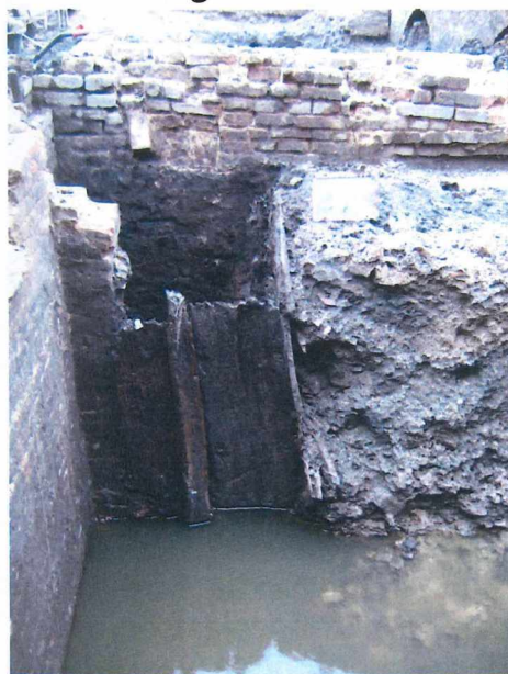
Figuur 4 Houten put in de grote bakstenen put

In het noordelijk deel van het opgravingsterrein aan de Verversdijk werd een indrukwekkende beerput aangetroffen. Het gaat om een bakstenen structuur, zonder spoor van een vloer, met zeer diep gefundeerde muren. Zowel de noordelijke als de oostelijke muur zijn minder hoog bewaard dan de andere muren. Beide muren zijn gedeeltelijk afgebroken voor de funderingen van het 19de-eeuwse schoolgebouw. Aan de zuidzijde lijkt de structuur verbouwd te zijn. Dit kunnen we afleiden uit het formaat van de bakstenen: de stenen in deze muur zijn beduidend kleiner dan die in de andere muren. Opmerkelijk in deze jongere muur is de aanwezigheid van een nisje, mogelijk te interpreteren als een kaarsnis. Dit doet de vraag rijzen of deze structuur oorspronkelijk niet als een gewone kelder dienst deed en pas later in gebruik genomen werd als