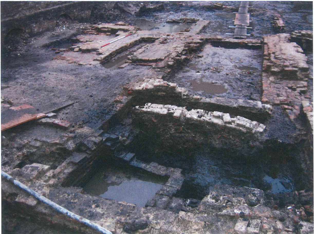
Figuur 3 Bewoningssporen

Vooraf de vele bewoningsresten springen in het oog, voornamelijk in de sector langsheen de Kandelaarstraat. Uit de wirwar aan muren en vloeren konden minstens drie of vier verschillende huizen onderscheiden worden, waarvan één grondplan bijna volledig was. Een aantal huizen die gekend waren uit de archiefbronnen konden hierdoor definitief gelokaliseerd worden. Onder de noemer 'bewoningssporen' horen niet alleen de huizen zelf, maar ook verschillende beerputten en waterputten. De beerputten dateerden uit de 15de en 16de eeuw.