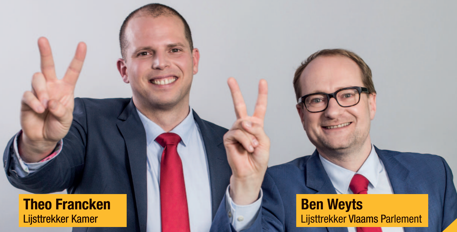
Theo Francken Lijsttrekker Kamer