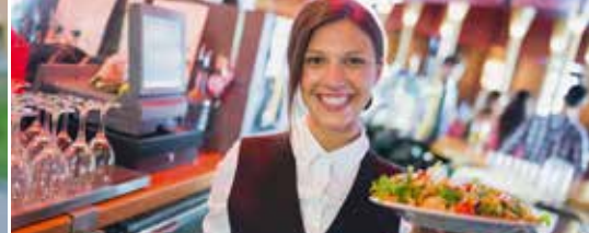
Basisaanbod aan retail en horeca in elke dorpskern (p. 3)