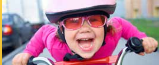
10 schoolomgevingen verkeersveiliger (p. 2)