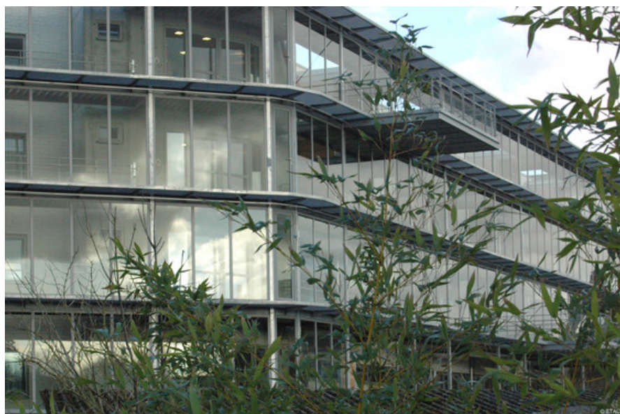
VERTEFEUILLE - RS © ETau