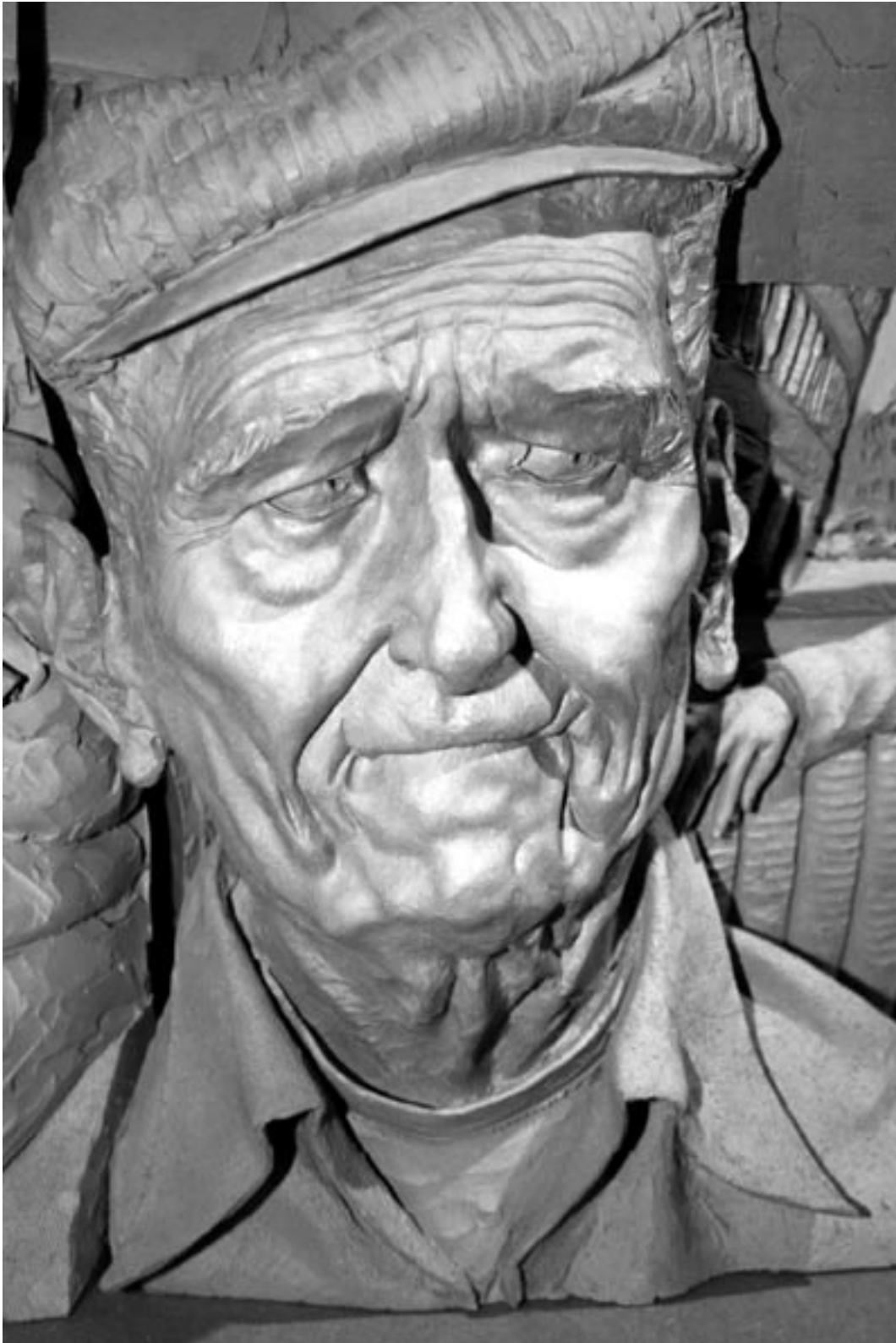
“Représentation de Bruxelles en terre cuite par Paul Day”