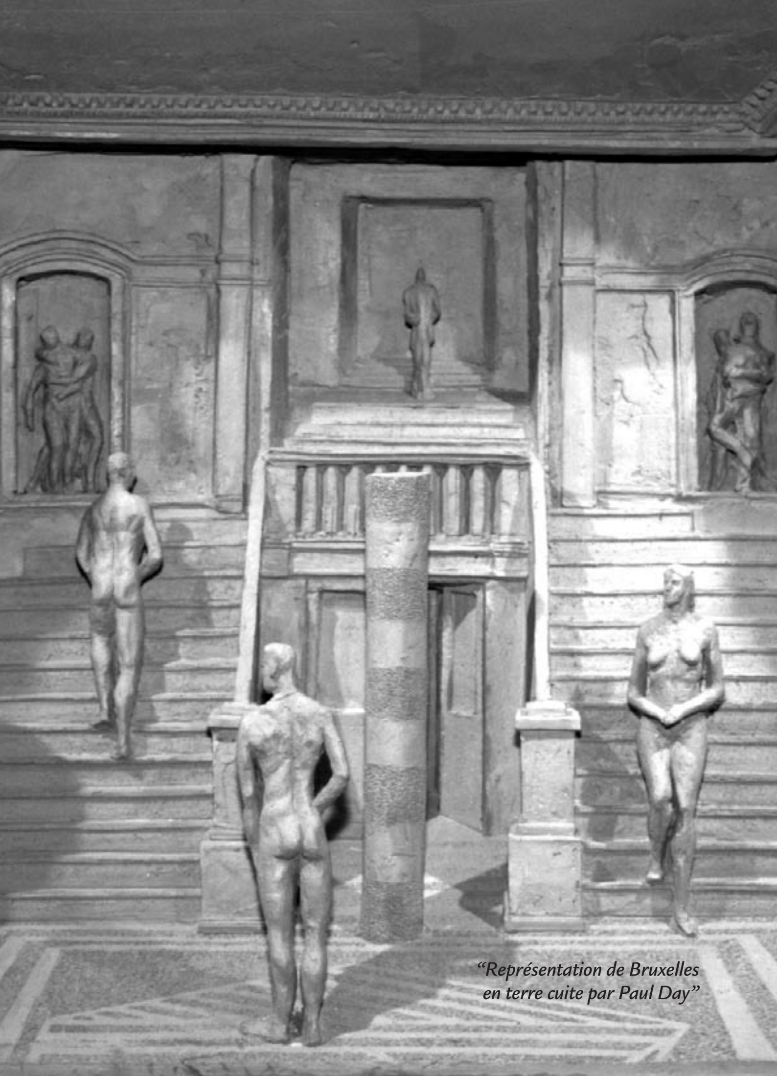
“Représentation de Bruxelles en terre cuite par Paul Day”