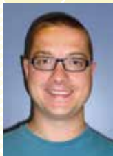
Joachim Van Impe