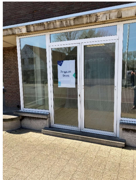
Zorg stopt niet aan de grens. Hoe organiseren we dat?