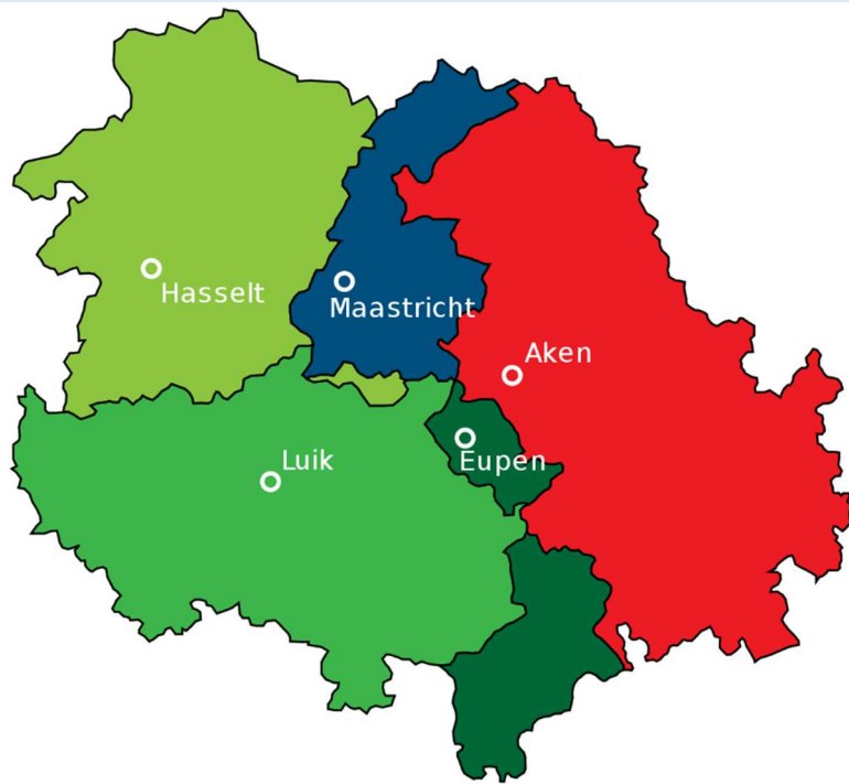
Kaart overgenomen van Wikipedia

Vaak gaat het om problematieken die het strikt lokale overstijgen 2 .