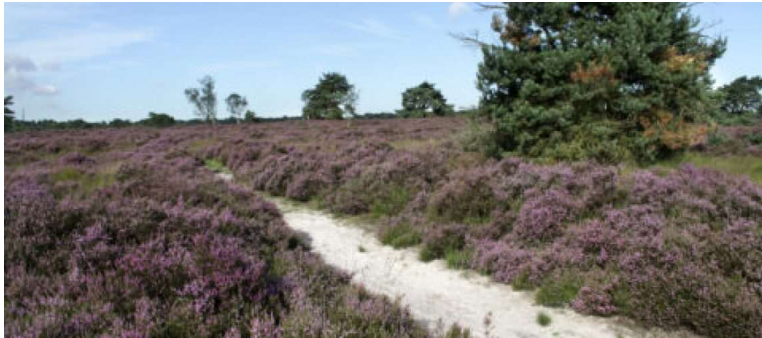
Grenspark Kalmthoutse Heide – Gezamenlijk natuurbeheer mogelijk door Benego samenwerking

Toen de bovenlokale financiering wegviel, moest men noodzakelijkerwijze inkrimpen, geen fysieke locatie meer en terugvallen op vooral de netwerkfunctie.