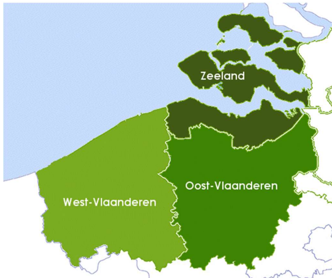
Kaart overgenomen van Webstek Scheldemond

Ten westen is Scheldemond actief. De organisatie werd in 1989 opgericht voor de grensoverschrijdende samenwerking van de provincies Zeeland, West-Vlaanderen en Oost-Vlaanderen. Ruimtelijke ontwikkeling, grensarbeid, onderwijs, veiligheid, economie en landbouw vallen in de focus van de organisatie. Aan de organisatie zijn vier medewerkers verbonden.