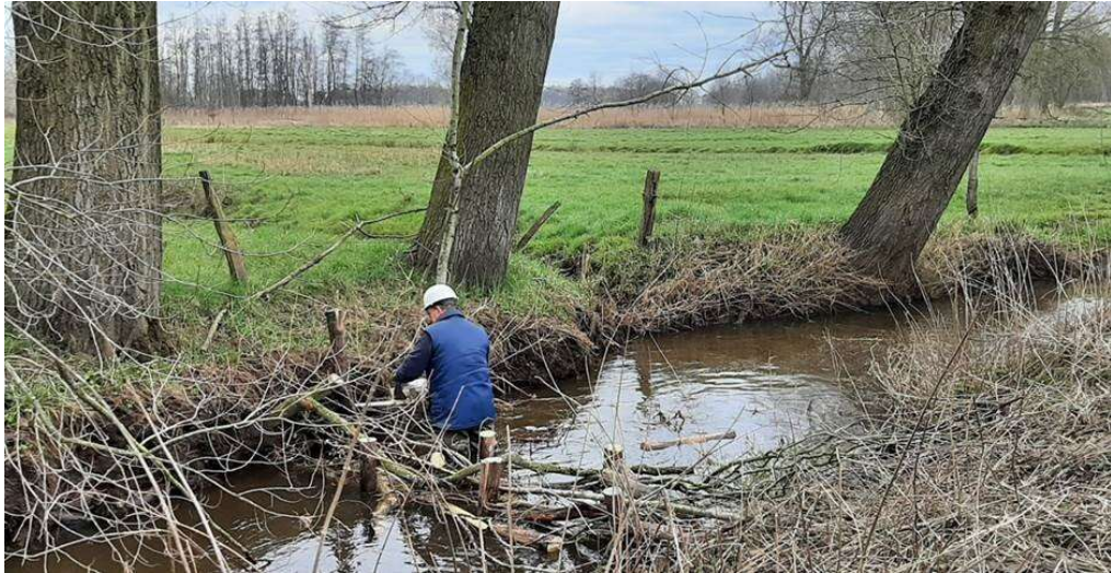
Een algemeen bestuur werd gewijd aan de waterproblematiek en vond plaats bij Waterschap Brabantse Delta. Waterschap Brabantse Delta en Provincie Antwerpen werken samen aan grensbeek het Merkske