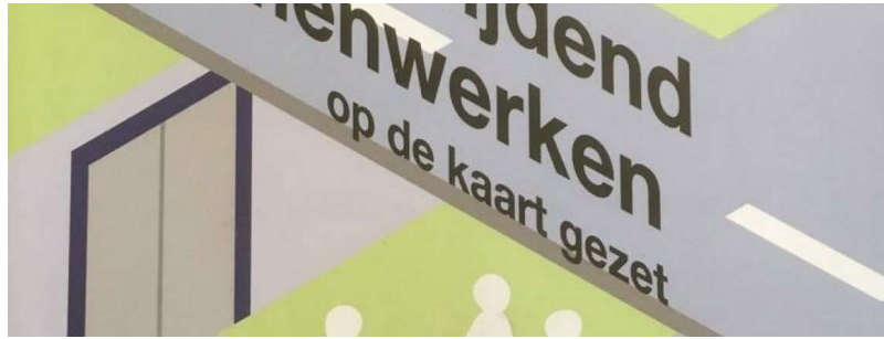
De Koerskaart van Baarle, leidraad om met grensknelpunten aan de slag te gaan