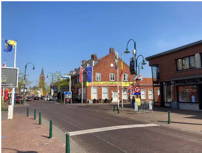
Grendorp Putte: 1 dorp, gespreid over 2 landen en 3 gemeenten. Hoe beheer je dat?