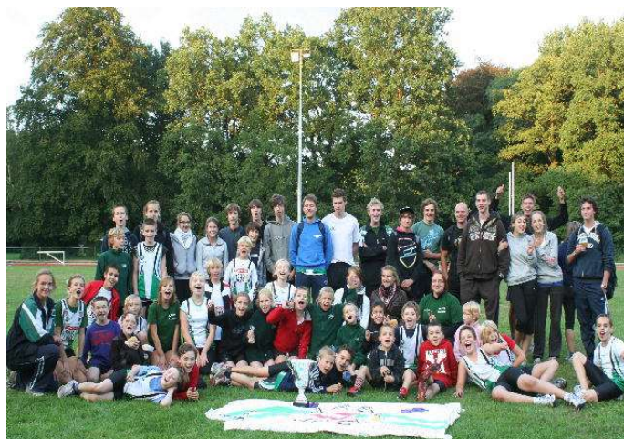
Onder Benego benaming vonden jarenlang grensoverschrijdende sportieve ontmoetingen plaats. Hier de deelnemers aan de 14de editie van de Benego Atletiek Cup in 2010 in Kapellen met deelname van teams uit Essen, Zundert, Breda, Dongen, Boechout en Kapellen

Geleidelijk aan groeide de organisatie. Er kwamen meer leden bij door uit te breiden naar het oosten. Er kwam lidgeld, zelfs een formele juridische structuur, een GOL (grensoverschrijdend lichaam). De nood aan personele ondersteuning nam toe. Die werd eerst ingevuld met door gemeenten ter beschikking gestelde medewerkers. Later, in de korte periode dat Vlaanderen en de provincies Benego subsidieerden, was er ook effectief vrijgesteld personeel, betaald vanuit de middelen waarover de organisatie beschikte. Op zijn top had Benego één voltijdse kracht (voor opvolging van