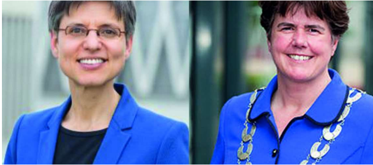
Gewaardeerd online overleg onder leiding van Antwerpse Gouverneur en Noord-Brabantse Commissaris van de Koning

Een andere optie kan erin bestaan om de provincies opnieuw actiever te betrekken bij de Benego-organisatie. Tot 2007 was er een structurele financiering vanuit de provincies die toeliet voltijdse ondersteuning voor Benego in te huren. Medewerkers van de twee provincies worden al wel betrokken bij de ambtelijke klankbordgroep, maar verder reikt de samenwerking nu niet.