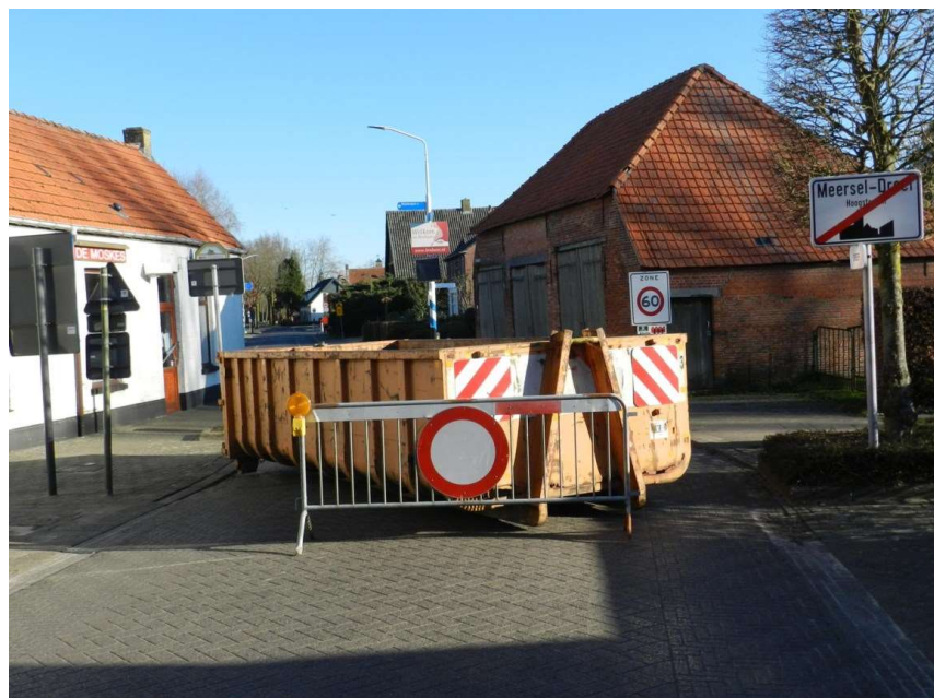
Covid. Plots was er weer een grens en kwam Benego aan zet

Men is tevreden over het rapport dat door Benego naar aanleiding van de Covid-problematiek