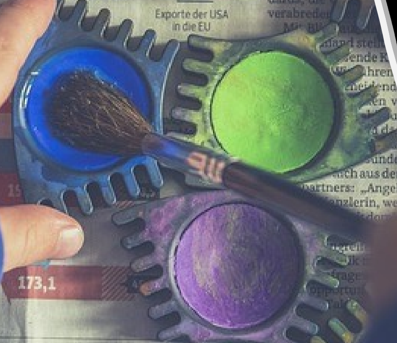
Exporte der USA in die EU