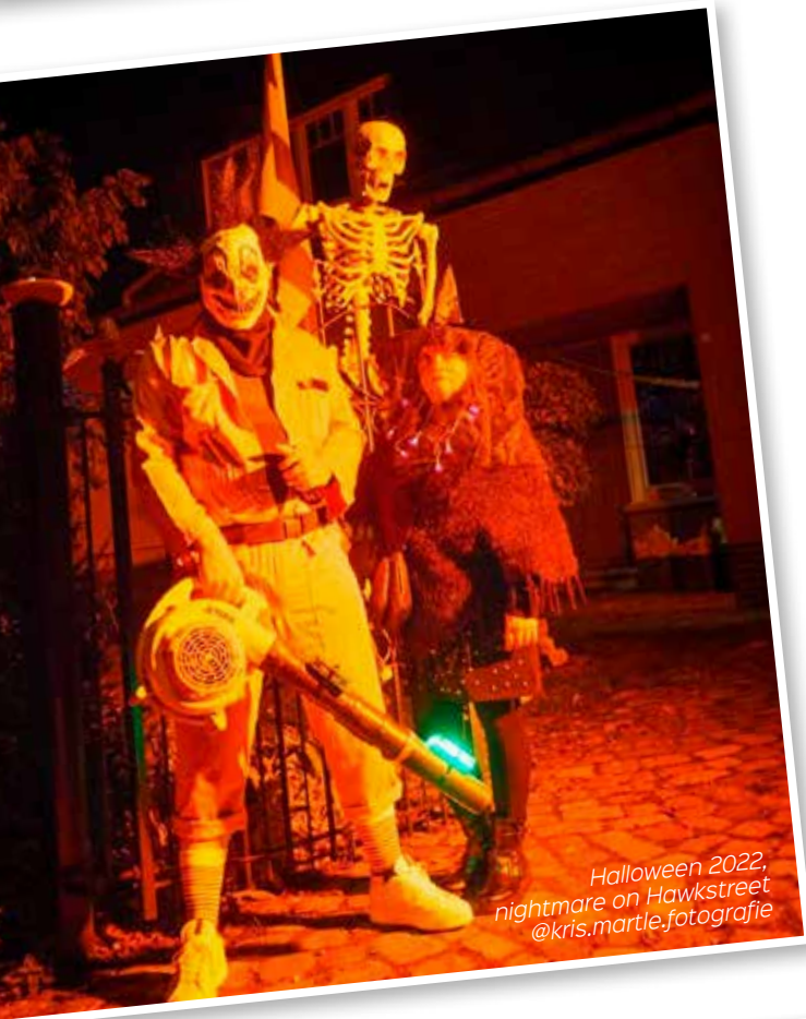
Halloween 2022, nightmare on Hawkstreet @kris.martle.fotografie