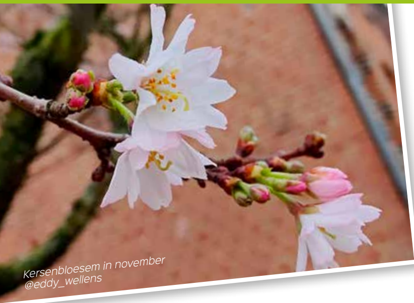
Kersenbloesem in november @eddy_wellens