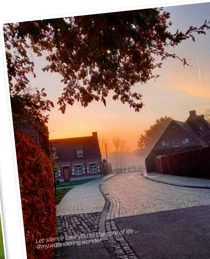
Let silence take you to the core of life ... @my.wandering.wonder