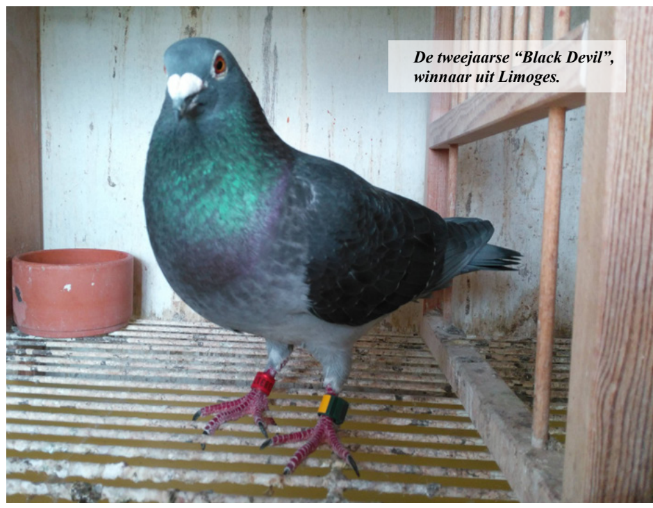
De tweejarige "Black Devil", winnaar uit Limoges.