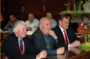
Nos nouveaux échevins honoraires