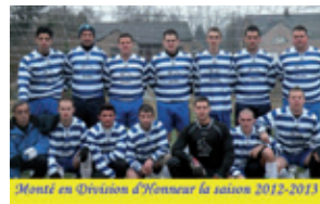
Monté en Division d'Honneur la saison 2012-2013