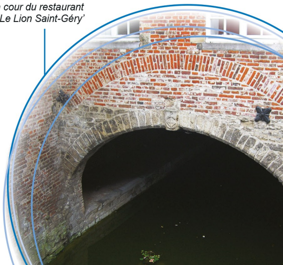
Ancien bras de la Senne dans la cour du restaurant 'Le Lion Saint-Géry'

L'état sanitaire de la Senne, véritable égout à ciel ouvert et vecteur important de maladies, justifiera aussi son recouvrement. Aujourd'hui, la qualité de l'eau de la Senne s'est améliorée avec la mise en fonction de deux stations d'épuration nettoyant les eaux usées des bruxellois!