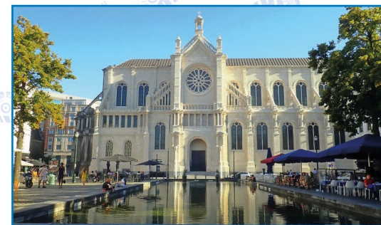
Bassin ornemental et église Sainte-Catherine

Par la rue du Rouleau (à droite) gagnez l'ancien bassin des Marchands ⑨. Tournez à gauche pour atteindre un bassin ornemental devant lequel repose une grande roue dentée, vestige du méca-