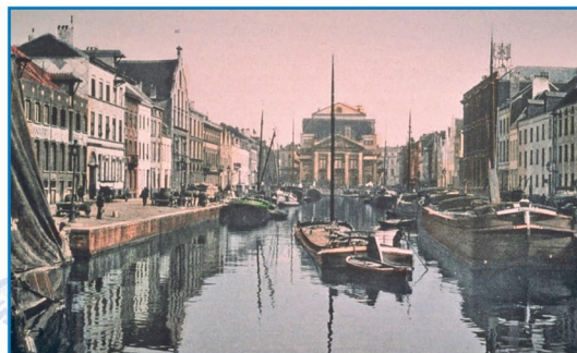
Bassin de l'Entrepôt - 1908

Jusqu'en 1561, les bateaux suivent les cours sinueux de la Senne, du Rupel et de l'Escaut pour rejoindre Anvers. La navigation sur la Senne est longue (parfois plusieurs semaines) et rendue difficile en période de basses eaux et de crues. C'est en 1561 qu'est achevé le canal de Willebroeck. Long de 28 km et alimenté par les eaux de la Senne, il permet de contourner la ville de Malines qui impose, sur la rivière, un péage au passage des bateaux à destination de Bruxelles. A l'intérieur des remparts de la ville débute le creusement des bassins du nouveau port.