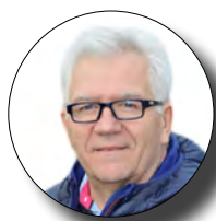
Christian Pastor Président Commission d'Organisation des Compétitions