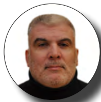
Michel Laurent relations avec le haut niveau / événementiel / technique