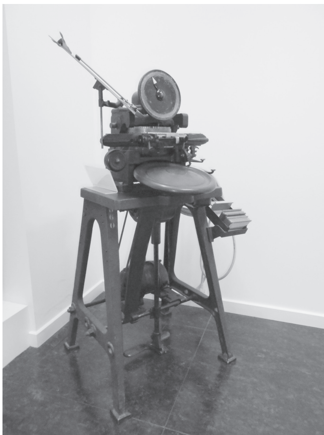
Stansmachine Adrema 1943 : Met een wiel werden letters geselecteerd die werden 'gestanst' op blikken plaatjes (zie lade rechts). De plaatjes, honderdduizenden verzameld in een placotheek, waren het basisbestand van de verzending. Het stansen, uitgevoerd door vrouwen, veroorzaakte een hels lawaai. Bij elke wijziging van de coördinaten van een werkgever moest een nieuwe plaatje worden aangemaakt. Samen met de uitgaven voor ponskaarten waren de kosten voor blikken plaatjes de belangrijke kostenplaatsen van een mecanografisch bedrijf.