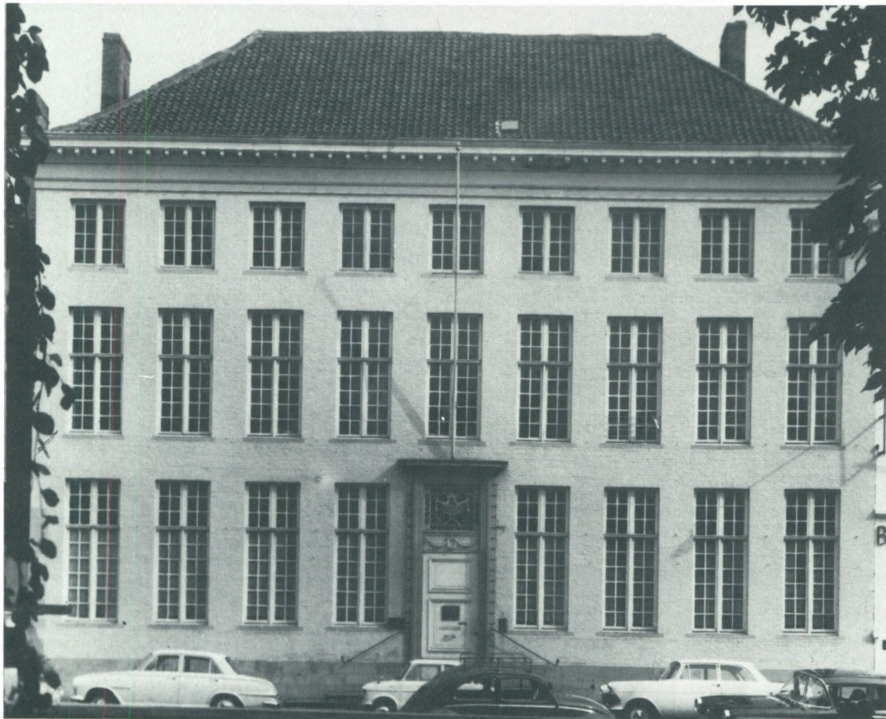
Huis Dijkster 7