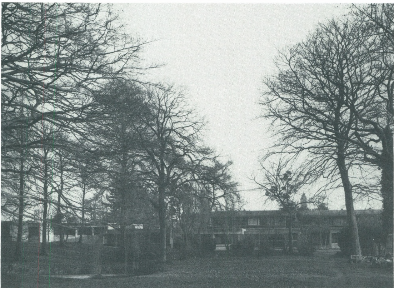
Huis Baron Ruzettelelaan 33