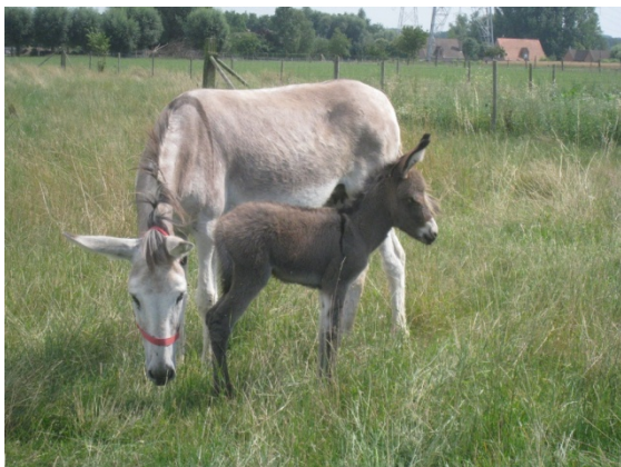
Fleur en Lily