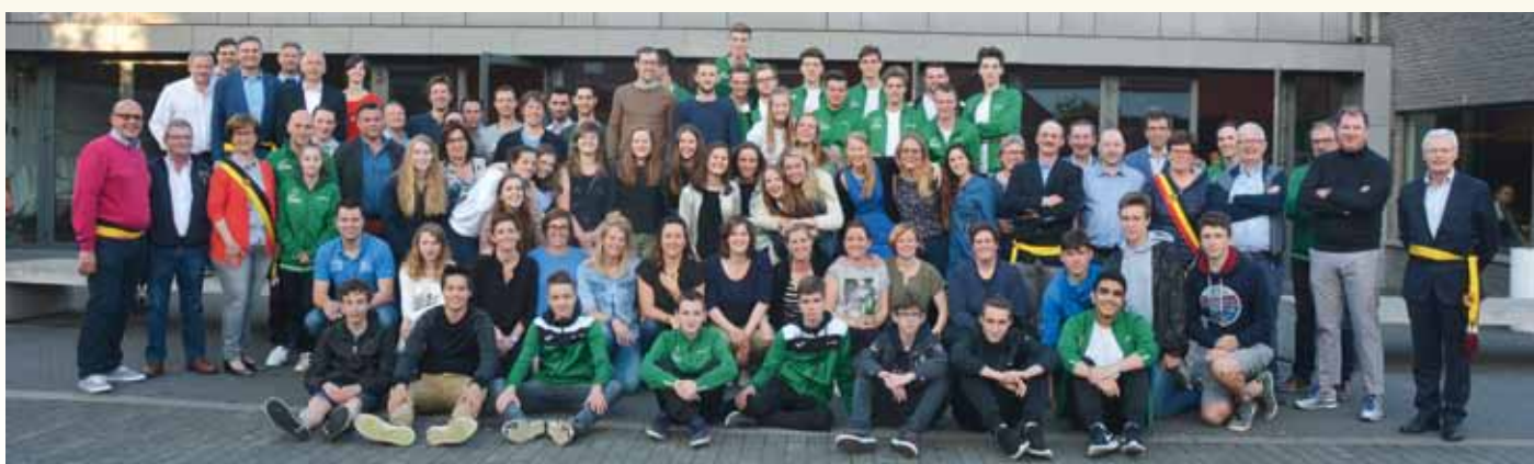
Sportkampioenen Lendeledede (19 mei 2017)