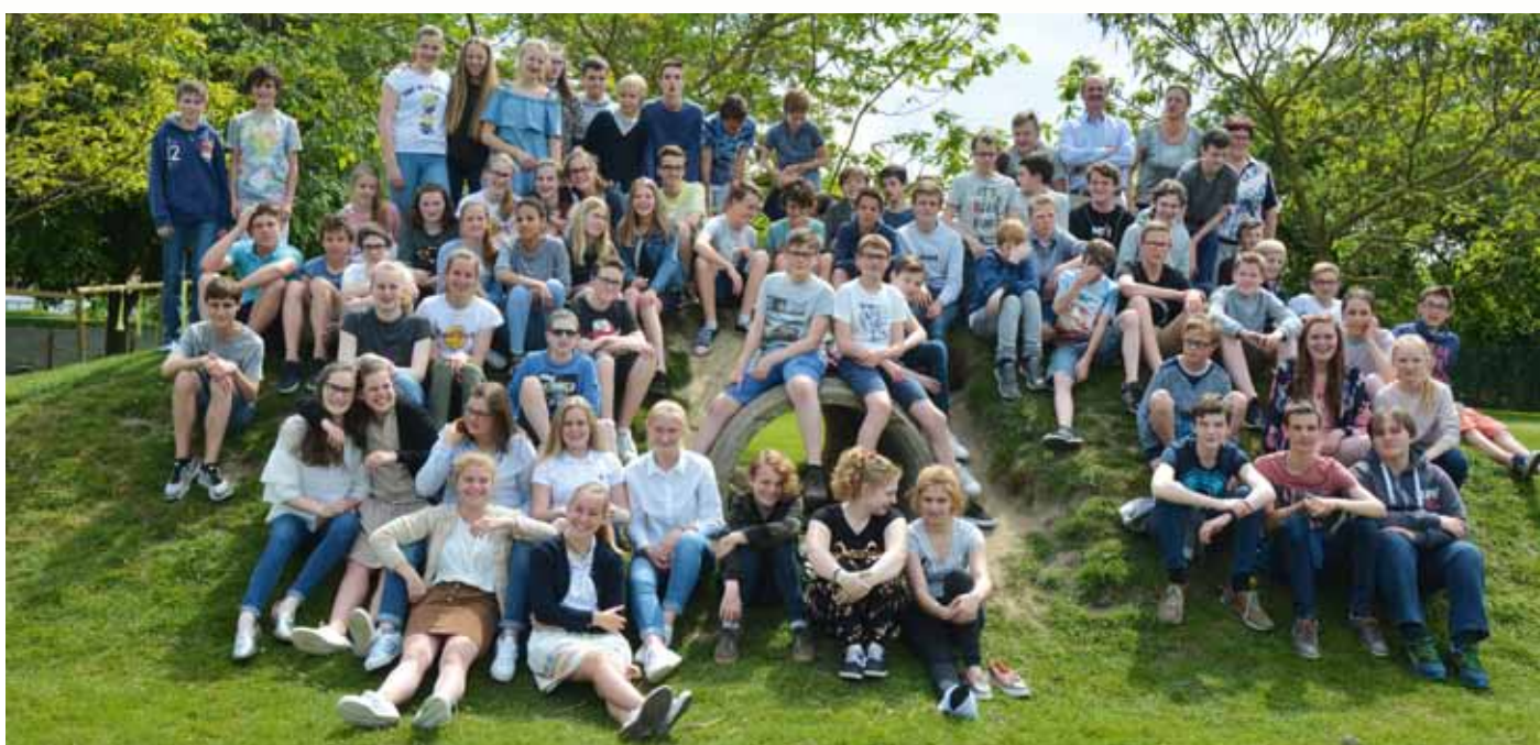
Rookvrije klassen middenschool Prizma (22 mei 2017)