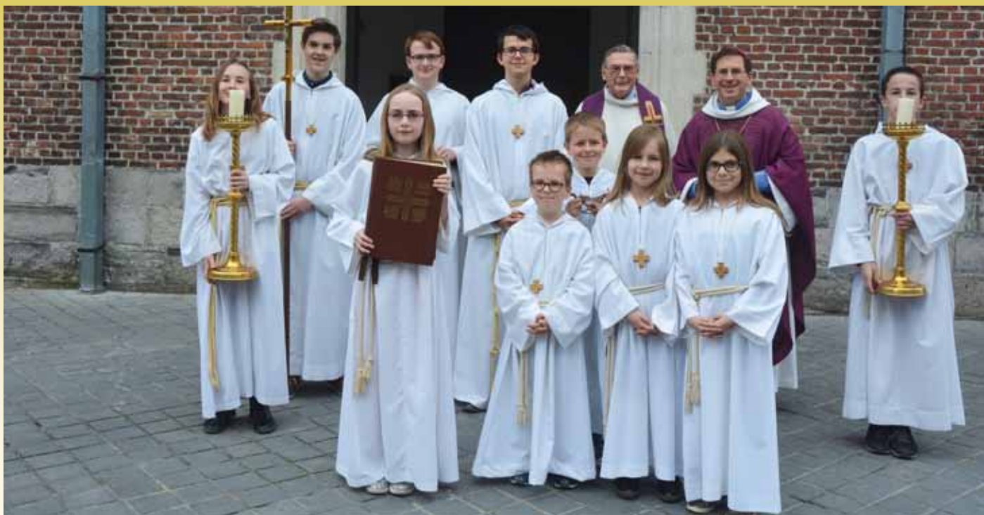
West-Vlaamse Accolietendag (1 april 2017)