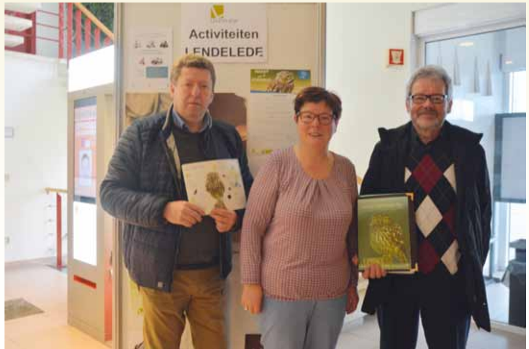
Nacht van de steenuil (25 maart 2017)