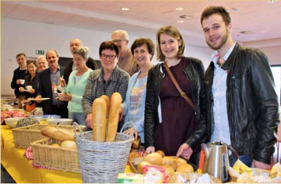
Ontbijt nieuwe inwoners (25 maart 2017)