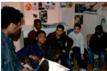
De nouvelles maisons de quartier pour nos jeunes (prochainement à Heyvaert, p.ex.) Nieuwe buurthuizen voor onze jongeren (weldra in de Heyvaertwijk bv.)

2. Er worden ontmoetingsplaatsen ingericht in de afdelingen die van de gemeentelijke preventiediensten afhankelijk zijn. We willen «Ambassades de citoyenneté» (ambassades