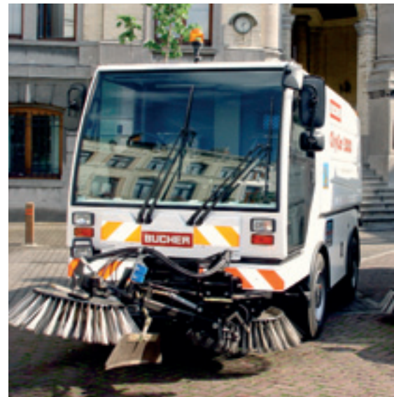
Veiller encore plus au nettoyage des espaces publics Nog meer aandacht voor de netheid van openbare ruimten

En matière d'environnement , la commune continuera à développer le maillage vert sur son territoire. La biodiversité sera renforcée par un aménagement écologiquement responsable des espaces verts (par ex. en préférant les essences indigènes, qui sont l'habitat naturel de notre faune). La Maison de la