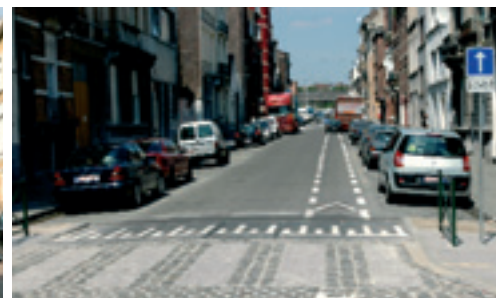
Nieuwe wegen in de oude wijken (bv.: Onafhankelijkheidsstraat) Nouvelles voiries dans les anciens quartiers (ex.: rue de l'Indépendance)

ten opgericht kunnen worden. Deze zullen worden ingevoerd op basis van wat er in de Maritiemwijk gebeurt (het nieuwe Gemeenschapscentrum Maritiem).