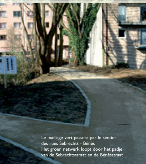
Le maillage vert passera par le sentier des rues Sebrects - Bénès Het groen netwerk loopt door het padje van de Sebrectsstraat en de Bénèsstraat