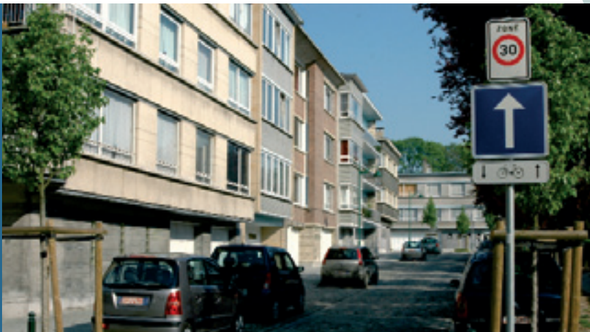
Etendre les zones 30 pour contrer le trafic de transit De «30 km/u zones» uitbreiden om het doorgaand verkeer te vermijden

Bref, d'importants changements auront lieu et les autorités vous informeront en temps utile sur toutes les mesures de mise en oeuvre du Plan : changements d'infrastructures, changements en matière de circulation routière, conditions de stationnement des habitants (sens unique dans telle rue, mise en place d'un carrefour, etc.).