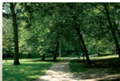
Molenbeek heeft vele kwaliteitsvolle groene ruimtes Molenbeek possède de nombreux espaces verts de qualité