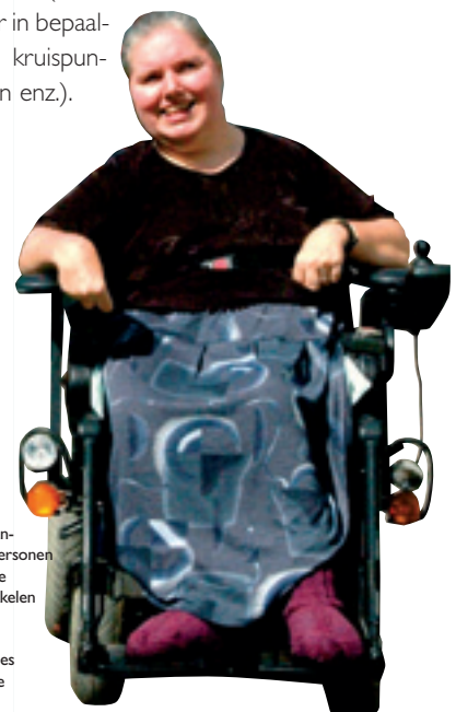
Een betere toegankelijkheid voor personen met een beperkte mobiliteit ontwikkelen Développer un meilleur accès pour les personnes à mobilité réduite

Kortom, er zullen aanzienlijke veranderingen optreden en het gemeentebestuur zal u ten gepaste tijde informeren over alle maatregelen voor de invoering van het Plan: infrastructuurveranderingen, veranderingen inzake wegverkeer, parkeeromstandigheden voor de bewoners (eenrichtingsverkeer in bepaalde straten, kruispunten inrichten enz.).