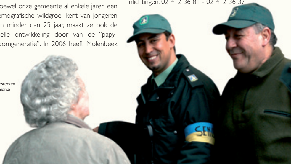
De «Seniorenbrigade» versterken / Renforcer la «Brigade Seniors»

Taxicheques : data voor het afhalen van de taxicheques bij het Kabinet van Sociale actie (Graaf van Vlaanderestraat 20) : 5 juni, 12 juni, 19 juni en 26 juni, van 9u tot 11u30. Gelieve uw identiteitskaart mee te brengen. Inlichtingen: 02 412 36 81 - 02 412 36 37