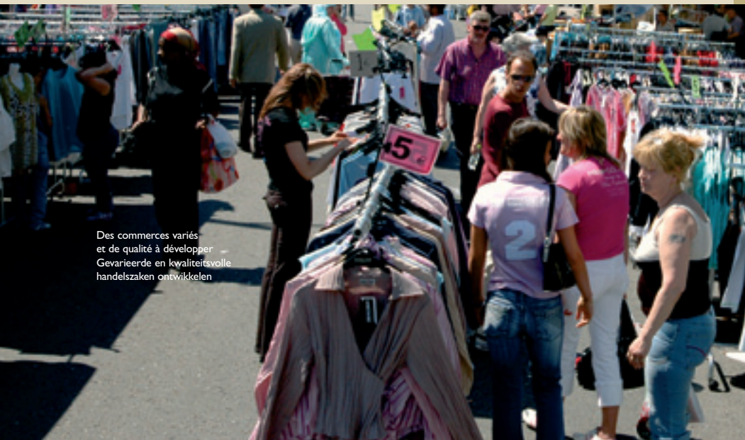
Des commerces variés et de qualité à développer Gevarieerde en kwaliteitsvolle handelszaken ontwikkelen

Enfin, en matière d'énergie, les marchés du gaz et de l'électricité étant libéralisés depuis 2007, chaque ménage molenbeekois devra être informé correctement des enjeux de la libéralisation, des possibilités offertes et des implications.