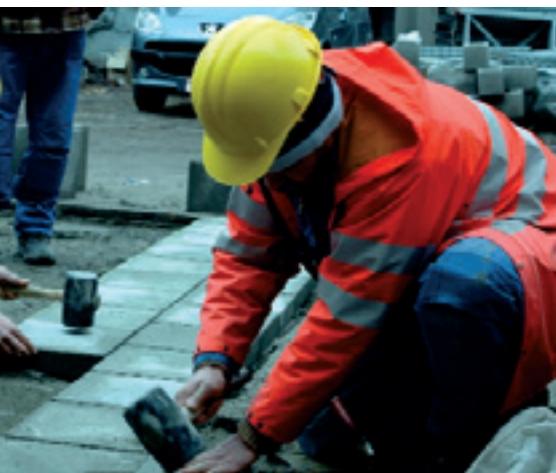
Een nieuwe job aanleren: opleiding inzake bestratingstechnieken Apprendre un nouveau métier : formation au pavage

Ondanks de huidige sociaaleconomische context, zal de gemeente tal van acties voor