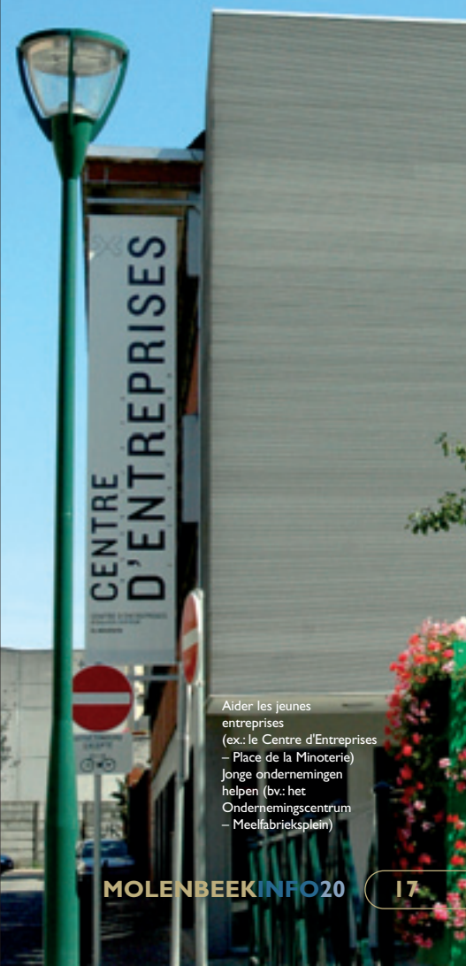
Aider les jeunes entreprises ex.: le Centre d'Entreprises – Place de la Minoterie Jonge ondernemingen helpen (bv.: het Ondernemingscentrum – Meelfabrieksplein)