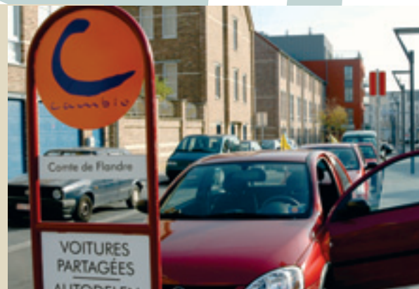
Mieux se déplacer en ville via les transports publics et Cambio. Dankzij het openbaar vervoer en Cambio kan men zich beter verplaatsen

N.B. : Opération 'DRING DRING 2007' lire en page 24, avis important N°2.