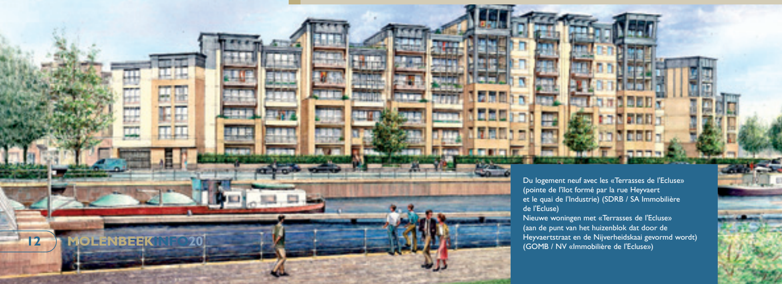
Du logement neuf avec les «Terrasses de l'Ecluse» (pointe de l'îlot formé par la rue Heyvaert et le quai de l'Industrie) (SDRB / SA Immobilière de l'Ecluse)

Depuis le 1er janvier 2007, il est obligatoire d'enregistrer les baux de location des logements. Cet enregistrement est gratuit jusque fin juin. Les propriétaires sont tenus de le faire. Pour les baux antérieurs, et tous types de questions à ce sujet, contactez le centre d'appel du service fédéral des Finances (Tél.: 02 572 57 57) ou, à Molenbeek, le service juridique Antenne J, avenue Jean Dubruçq, 82 (Tél.: 02 422 06 11).