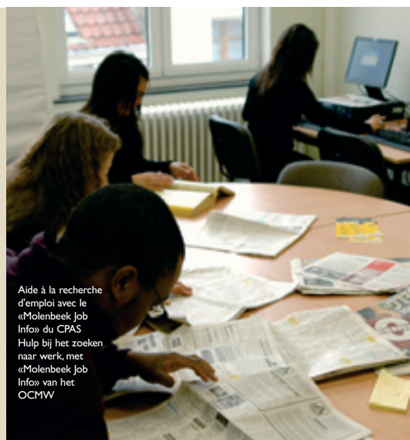
Aide à la recherche d'emploi avec le «Molenbeek Job Info» du CPAS Hulp bij het zoeken naar werk, met «Molenbeek Job Info» van het OCMW

A l'issue de ces journées de réflexion, le Centre compte développer encore plus sa politique de prévention pour éviter l'exclusion. Il s'agira aussi de faire mieux participer chacun à l'amélioration du mieux-être général.