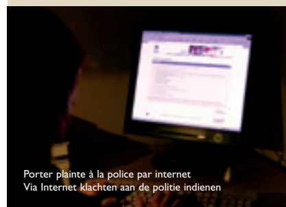
Porter plainte à la police par internet Via Internet klachten aan de politie indienen