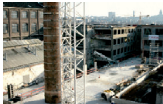
Birmingham site (12.600 m 2 ) : gemengd project voor huisvesting en economische activiteiten (NV Birmingham -GOMB, vereniging JCX Immo en CIT Blaton-) Site Birmingham de 12.600 m 2 : projet mixte logement et activités économiques (SA Birmingham -SDRB, association JCX Immo et CIT Blaton-)

De sociale woningen zullen grondig gemoderniseerd worden. «Le Logement Molenbeekois», die al meer dan 100 jaar geleden opgericht werd, is de tweede Openbare Vastgoedmaatschappij van het