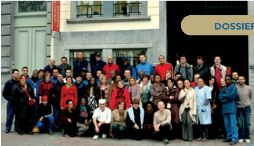
La Mission locale pour l'Emploi à votre service • De Lokale missie voor werkgelegenheid tot uw dienst

Les jeunes figurent aussi au rang des priorités de la politique de solidarité communale. Car rappelons que Molenbeek connaît un extraordinaire rajeunissement de sa population, surtout parmi les moins de 25 ans. Ce qui représente un atout. La nouvelle