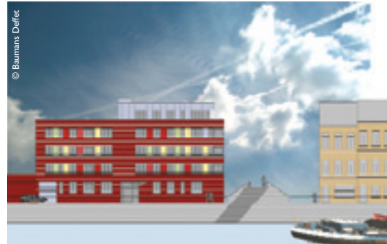
Construction de bâtiments pour du logement au Quai de l'Industrie / angle Gosselies (Contrat de quartier «Heyvaert») Constructie van gebouwen voor huisvesting op de hoek tussen de Gosseliesstraat en de Nijverheidskaai (Wijkcontract «Heyvaert»)

Le logement social sera, lui aussi, profondément modernisé. Fondée voici plus de