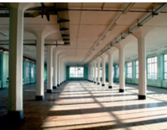
BAT permettra de développer l'économie et le logement Met BAT zullen de economie en de huisvesting ontwikkeld kunnen worden

En collaboration avec les autorités régionales, fédérales et européennes, les autorités communales continueront de chercher de nouveaux financements pour poursuivre cette revitalisation générale, au sein des quartiers concernés comme sur d'autres périmètres prioritaires. Elles souhaitent que ces nouveaux financements soient d'abord destinés à améliorer les quartiers Gare de l'Ouest / Saint-Lazare, Vandenpeereboom, ... avec - et c'est une première - un élargissement du périmètre au-delà du chemin de fer.