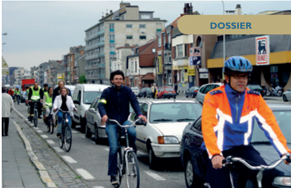
Meer fietspaden inrichten • Aménager plus de voiries pour les vélos

N.B. : Actie 'DRING DRING 2007' zie blz. 25, belangrijk bericht Nr. 2.