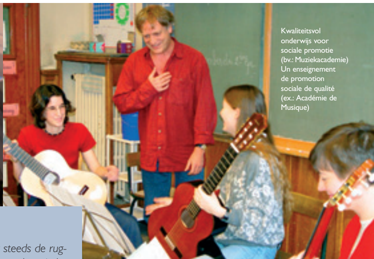
Kwaliteitsvol onderwijs voor sociale promotie (bv.: Muziekacademie) Un enseignement de promotion sociale de qualité (ex.: Académie de Musique)