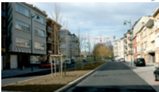
Renovatie van de wegen in het Nieuwe Molenbeek (bv.: Landmeterstraat) Rénovation des voiries dans le haut (ex.: rue du Géomètre)

Er staan echter nog vele uitdagingen te wachten. De gemeente zal specifieke projecten opstarten waarmee echte wijkpun-