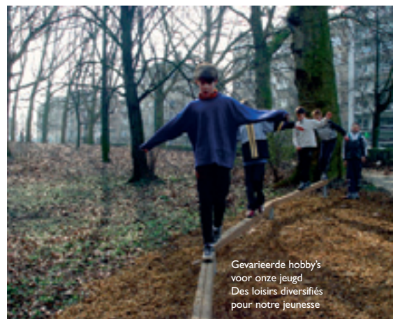
Gevarieerde hobby's voor onze jeugd Des loisirs diversifiés pour notre jeunesse

De gemeente werkt de sociaalsportieve animaties nog meer uit, daar waar dit nodig blijkt. Het gemeentelijk sportaanbod zou op het ganse gemeentelijk grondgebied aanwezig moeten zijn. Maar Molenbeek telt ook tal van sportinfrastructuren: het Sippelbergstadion, het gemeentelijk Edmond Machtensstadion, waar de elite van het Molenbeekse voetbal speelt, en dan zijn er ook nog de privé-infrastructuren. Naar het voorbeeld van de visie op de maatschappij, die de nieuwe meerderheid verdedigt, moeten de opwaardering van de individuele inspanningen en de samenwerking in de ploegsporten verder gezet worden, alsook de steun aan privé-sportclubs en -verenigingen.