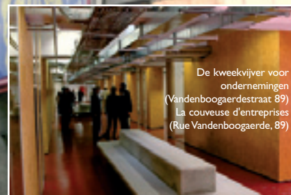
De kwekvijver voor ondernemingen (Vandenboogaerdestraat 89) La couveuse d'entreprises (Rue Vandenboogaerde, 89)

Ten slotte, zullen alle belangrijke initiatieven zoals de oprichting van een kwekvijver voor ondernemingen , het Loket voor plaatselijke economie alsook de Ondernemingscentra voortgezet worden. Ter herinnering: het Loket voor plaatselijke economie bevordert en vergemakkelijkt de installatie van jonge ondernemingen in Molenbeek, terwijl het Centrum voor jonge ondernemingen lokalen ter beschikking stelt die aan hun activiteiten aangepast zijn, maar ook dienstverleningen inzake secretariaat en logistiek, en dit aan gereduceerde prijzen.