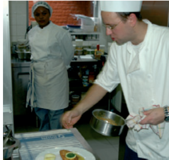
De sociaalprofessionele projecten voor inschakeling voortzetten (bv.: opleiding voor jobs in de horecasector) Poursuivre les projets d'insertion socio-professionnelle (ex.: formation aux métiers de l'Horeca)