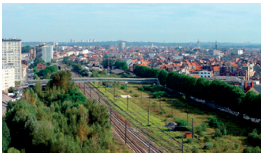
Le site de la Gare de l'Ouest va connaître une nouvelle vie • Nieuw hoofdstuk voor de site van het Weststation

• La gare de l'Ouest : considérée comme une coupure dans le tissu urbain, elle deviendra une charnière entre les deux parties de Molenbeek. La cohésion à l'intérieur et entre les quartiers constitue une des priorités de la Majorité. Plusieurs fonctions devront être mises en place, selon les réels besoins du quartier et de la commune, pour trouver un équilibre entre les secteurs de l'économie, de l'enseignement, de la formation, de la culture, des loisirs, du logement, des espaces verts.