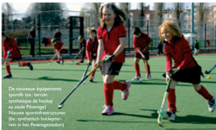
De nouveaux équipements sportifs (ex.: terrain synthétique de hockey au stade Pévenage) Nieuwe sportinfrastructuur (bv.: synthetisch hockeyterrein in het Pevenagestadion)