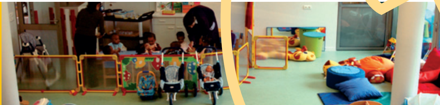
Créer de nouvelles crèches (ex.: Maison d'accueil «Olin») / Nieuwe crèches oprichten (bv.: Onthaalhuis «Olin»)

Chèques-taxi : vous pourrez retirer vos chèques-taxis au Cabinet de l'Action sociale (rue du Comte de Flandre, 20), de 9h à 11h30, les 05 juin, 12 juin, 19 juin et 26 juin. Veuillez vous munir de votre carte d'identité. Renseignements : 02 412 36 81 - 02 412 36 37