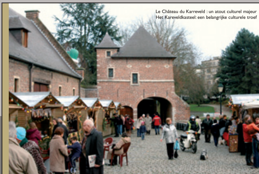
Le Château du Karreveld : un atout culturel majeur Het Kareveldkasteel: een belangrijke culturele troef

Il y aura également une nouvelle bibliothèque néerlandophone, rue du Jardinier, qui sera bientôt le lieu au centre de la vie culturelle néerlandophone à Molenbeek avec ordinateurs à disposition du public, formations et nombreuses formes d'expression artistique : vernissages, soirées poésie, expositions, ... et une attention particulière pour les écoles. Enfin, la bonne collaboration entre tous les partenaires culturels communaux se poursuivra avec le Vaartkapoen, le service de la Culture francophone et la Maison des Cultures et de la Cohésion sociale.