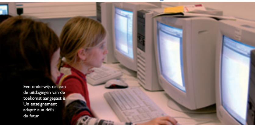
Een onderwijs dat aan de uitdagingen van de toekomst aangepast is Un enseignement adapté aux défis du futur