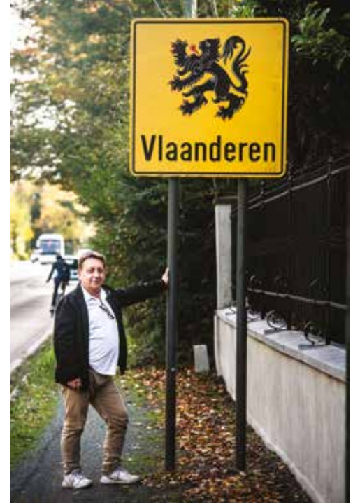
‘Als Vlaams-nationalist campagne voeren in het Frans? Nee, dat kan ik niet.’