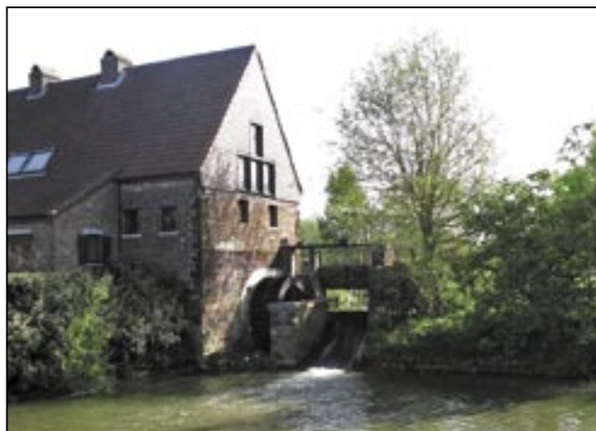
Hagelandse vallei, de Uythemmolen.

landschapscentrum kunnen een boost geven aan Tienen als een ‘Tintelende Stad’. Vorsdonk en de Demervallei kunnen hetzelfde betekenen voor Aarschot, en de openlegging van de Demer tezamen met een netwerk van natuurgebieden hetzelfde voor Diest. Een levende Dijle in Leuven kan ook zo’n sterk merk worden. Bij elk van deze keuzes is er een krachtige natuurbeweging met visie en