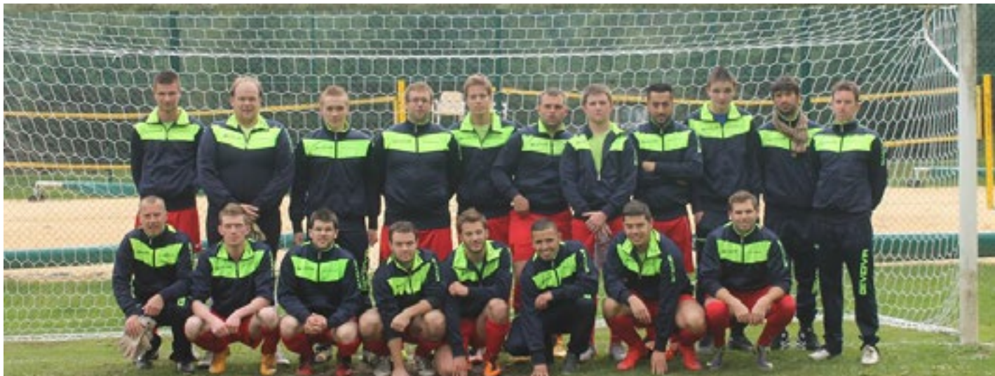
■ L'équipe du SC Chestrolais va de l'avant.

entraîneur de l'équipe première. Il devient également le CQ du club qui conserve l'ancien numéro matricule. Ce changement, effectif au terme de cette saison, permet aussi de se débarrasser des dettes de l'ASBL.