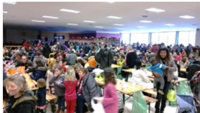
■ Ambiance Grand'Place et dans l'Espace 29.