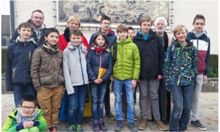
■ Prochaine visite guidée samedi 9 avril . Inscriptions au 061/27 88 67

Dans le cadre de l'éveil au numérique de l'EPN ce jeu consiste à reconstruire le château, d'où l'intérêt de découvrir la carte d'Arenberg, la rue des Fossés, le rue de la Tour Griffon, la reconstruction vue depuis le sentier des remparts, la place du Château, la rue du Château.