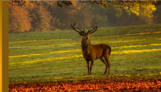
Mammifère herbivore Taille : 1,50 m (garrot) Poids : 250 kg