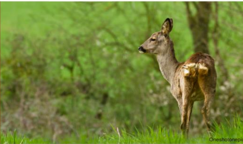
Mammifère herbivore Taille : 70 cm (garrot) Poids : 26 kg