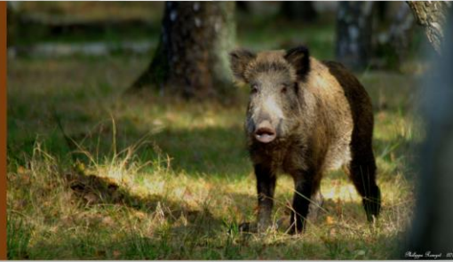
Mammifère omnivore Taille : 95 cm (garrot) Poids : 150 kg