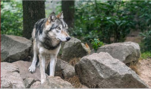
Mammifère carnivore Taille : 80 cm (garrot) Poids : 40 kg