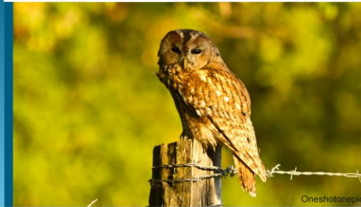
Oiseau carnivore Taille : 39 cm Poids : 590 g