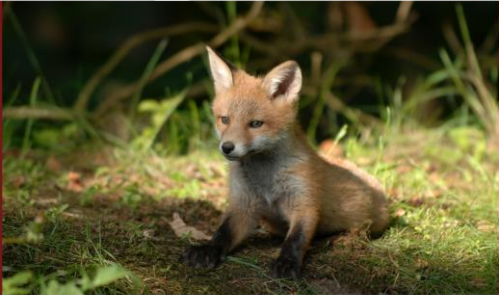
Mammifère carnivore Taille : 66 cm Poids : 6,2 kg