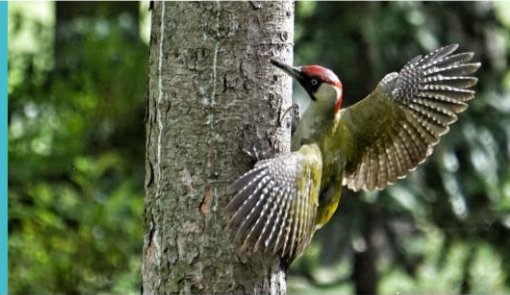
Oiseau insectivore Taille : 33 cm Poids : 220 g