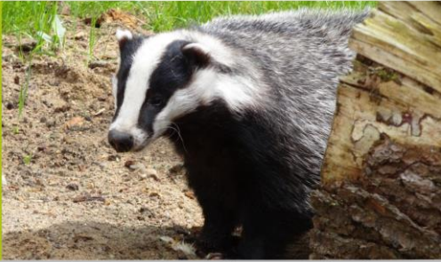
Mammifère omnivore Taille : 90 cm Poids : 12 kg