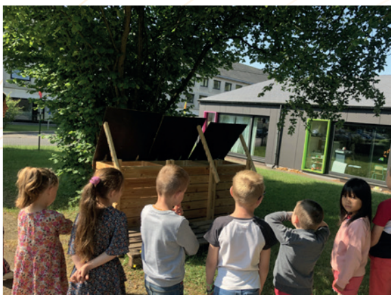
Animation « compost » à l'école