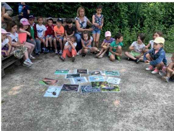
Animation « compost » à l'école