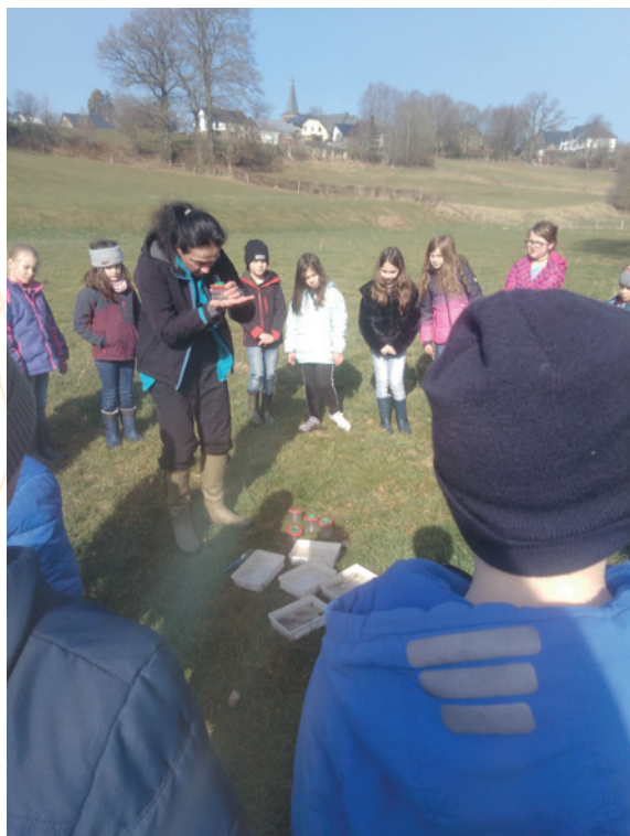
Animation « aquarium et eau » à l'extérieur