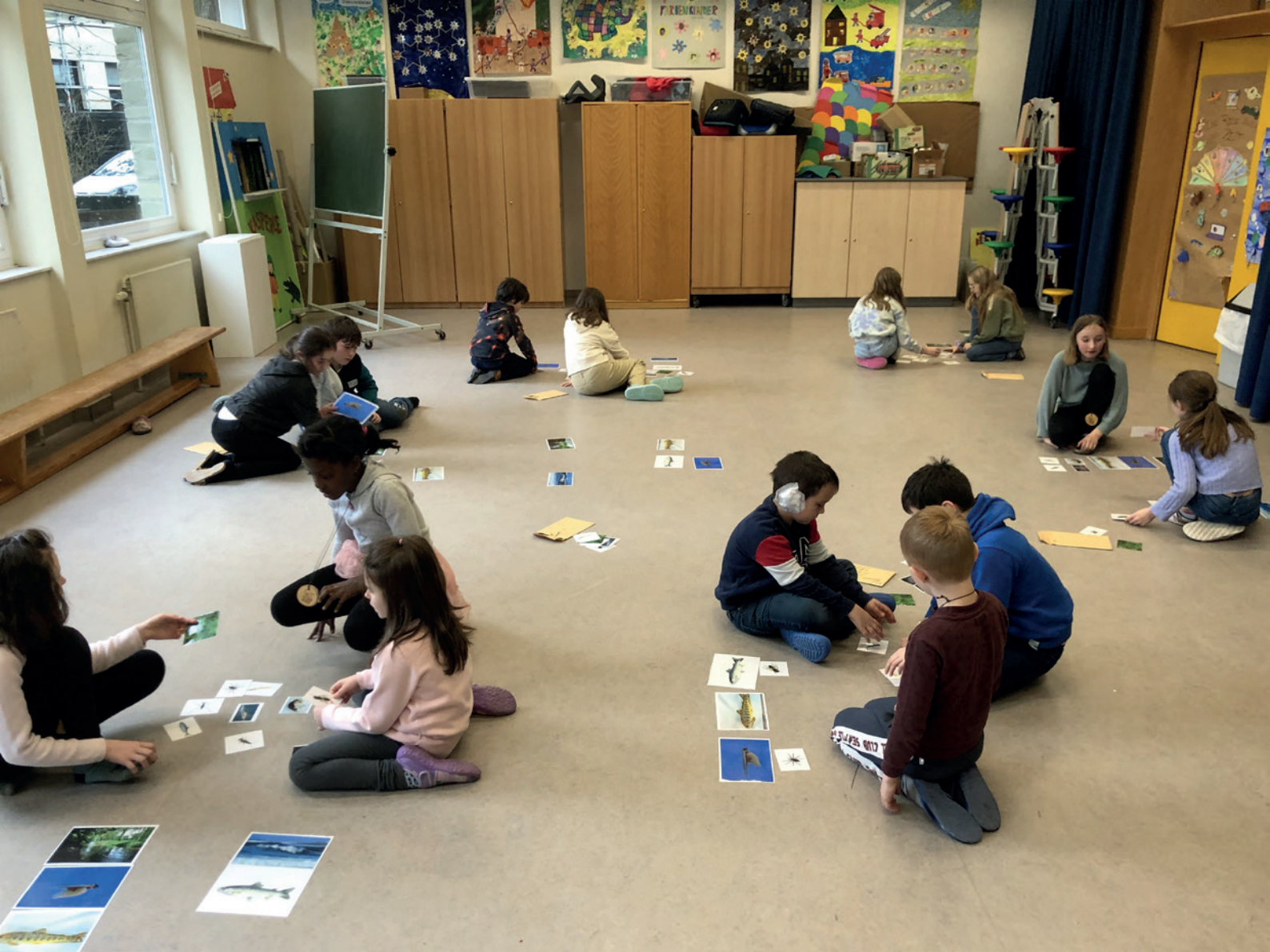
Animation « aquarium et eau » en classe