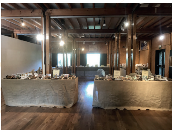
Fête des champignons