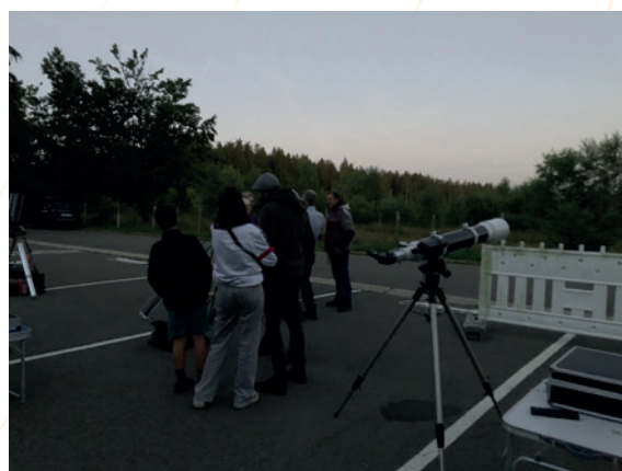
Nuit des étoiles filantes