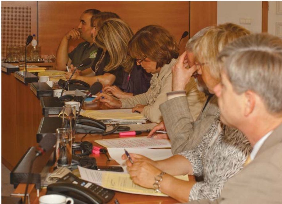
Plenaire vergadering - fractievoorzitters

werken Muntpunt en tijdelijk onderkomen voor HOB – Actualiteitsvraag: subsidiëring van vzw Averroës