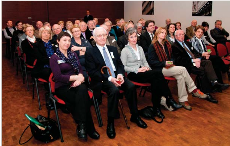
Gewezen VGC-raadsleden en gewezen Vlaamse parlamentsleden