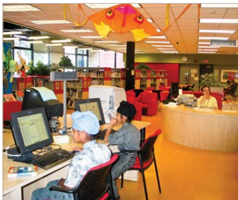
Wijkbibliotheek William Hingston