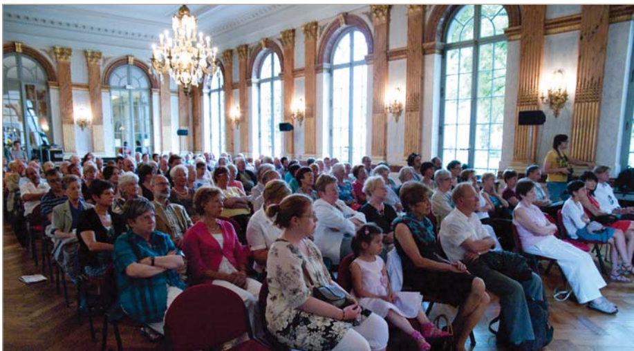
Concert in de Spiegelzaal

De traditionele concerten in de Spiegelzaal van het Brussels Hoofdstedelijk Parlement, de opendeurdag in het Huis van de Raad, de tentoonstelling "Brussel in de strip" en de afsluitende receptie werden samen door 1.543 bezoekers en genodigden gewaardeerd.