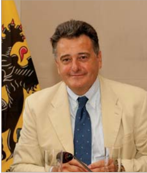
Jean-Luc Vanraes, bevoegd voor Onderwijs, Vorming en Begroting

Het College van de Vlaamse Gemeenschapscommissie is samengesteld uit 3 leden: de twee Vlaamse ministers en de Vlaamse staatssecretaris van de Brusselse gewestregering.