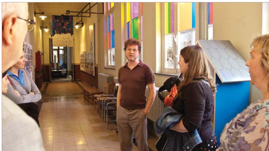
Huis van Culturen en Sociale Samenhang