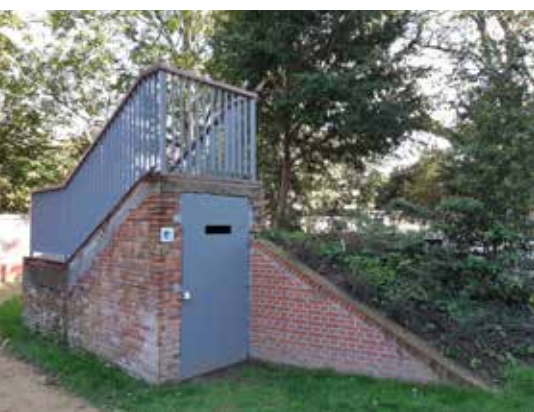
In de nieuwe toegangsdeuren is een invliegopening voor vleermuizen voorzien.

In de tuin van het appartementsblok van Dijledal in de Fonteinstraat in Leuven, bevindt zich een schuilkelder uit WO II. Het appartementsblok is recent gerenoveerd en de tuin is omgetoverd tot een publiek parkje. De schuilkelder werd gerestaureerd en ingericht als winterverblijf voor vleermuizen. Vleermuizen gaan na de zomer immers steevast op zoek naar een rustige, vorstvrije en vochtige schuilplek om te overwinteren. Bij gebrek aan grotten voldoen in onze streek forten, bunkers en (ijs)kelders aan hun eisen. Dijledal en de Stad Leuven werkten hiervoor samen met Regionaal Landschap Dijleland vzw. De provincie Vlaams-Brabant zorgde voor financiële steun.