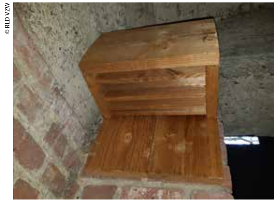
In deze speciale kast kunnen de vleermuizen wegkruipen om de winter door te brengen.