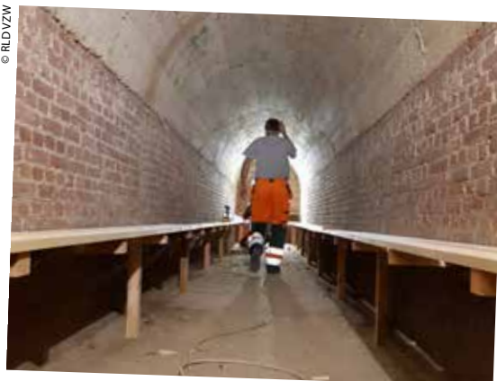
Reconstructie van de zitbanken in de langwerpige schuilkelder.