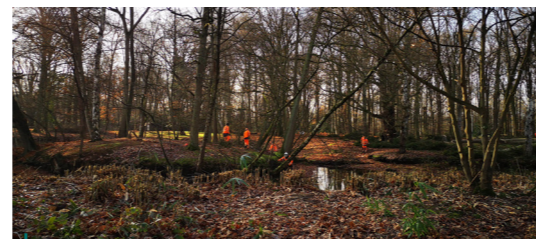
In park Elzenhof werden op de oevers van de bestaande vijver bomen en struiken weggehaald zodat er meer licht op het water valt. Zo krijgen verschillende waterplanten en -dieren meer kans.

Samen met stad Aarschot maakten we de afgelopen 4 jaar deel uit van het Europees project '2B Connect Bedrijven en Biodiversiteit'. We staken de handen uit de mouwen om het park Elzenhof om te vormen naar een park waar biodiversiteit en recreatie hand in hand gaan. In de toekomst wordt nog een verbinding voorzien tussen het park en het aangrenzende bedrijventerrein Nieuwland zodat werknemers van deze site in een groene omgeving kunnen ontspannen tijdens hun middagpauze.