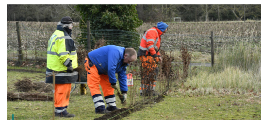
... 3376 m hagen, heggen en houtkanten aangeplant of hersteld.