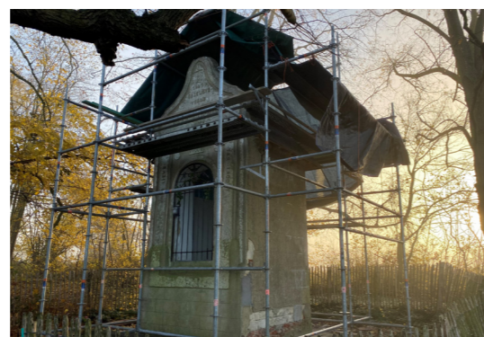
De lindes rond de Speelbergkapel kregen een snoeibeurt, waarna de restauratiewerken aan de kapel konden beginnen. De aannemer legde een nieuw leien dak en herstelde waar nodig de bezetting.

Op de grens tussen Lubbeek en Holsbeek prijkt de Speelbergkapel uit 1661. De kapel is omringd door vier lindes. Een vallende tak beschadigde het dak echter ernstig waardoor een dringende restauratie aangewezen was. Bijkomend drong ook een inspectie van de bomen zich op.