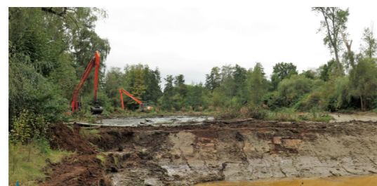
De uitheemse planten en de silblaag werden verwijderd. Daarnaast werden de oevers van 3 vijvers aangeschuid. Deze zorgen dat er verschillende waterdieptes ontstaan. Door de inval van zonlicht warmt het water in het voorjaar op, ideaal voor heel wat waterorganismen.

Daarom hebben we in Zichem werken uitgevoerd om zeven overwoekerde vijvers om te vormen naar een thuis voor verschillende streekeigen planten en dieren . We hopen na deze werken verschillende dier- en plantensoorten zoals drijvende waterweegbree, kleine watersalamander of watervleermuis te verwelkomen.