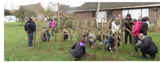
In Diest werd tijdens een workshop, georganiseerd door de provincie, een wilgenhut geplaatst.