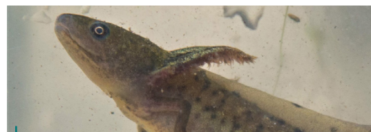
We zijn verheugd dat we in Rotselaar larven van de kamsalamander terugvonden in poelen die we de voorbije jaren geruimd hebben.

We blijven ons in de toekomst inzetten om habitat- en verbindingzones te creëren. Dit doen we door bestaande waterpartijen te onderhouden, nieuwe poelen te graven en natuurverbindingen te creëren door de aanleg van kleine landschapselementen.