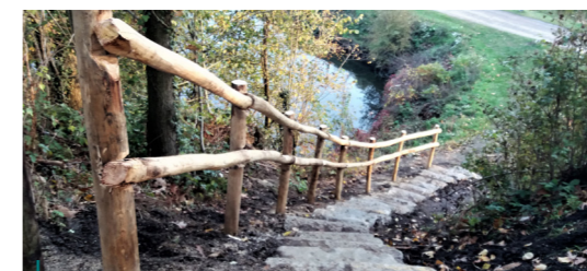
Aan de oude stadswallen in Diest werden op verschillende plaatsen nieuwe trappen aangelegd. Deze zorgen voor een betere en veiligere ontsluiting richting de Demertrefplaats op het Boerenkrijpplein.