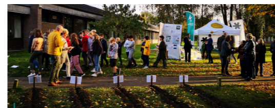
De leerlingen van de Middenschool in Keerbergen plantten 550 bloembollen aan als startschot van de vergroening van hun speelplaats. Dit alles in het kader van een 'Natuur op School'-project.

De vraag van scholen om hun speelplaats te vergroenen blijft toenemen. Het afgelopen jaar hebben wij samen met de MOS-medewerker van de provincie Vlaams-Brabant twee basisscholen en twee secundaire scholen begeleid.