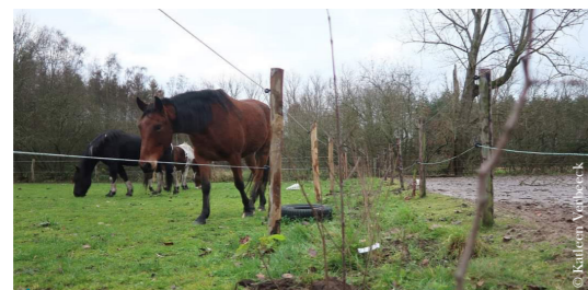
Er komt maar liefst 1,3 kilometer aan paardvriendelijke haag bij in de Vlaams-Brabantse paardenweides.

In Noord-Hageland bestelden 255 inwoners in totaal 14.130 stuks streekeigen plantjes, 614 hoogstambomen, 38 wilgenpoten, 14 wilgenhutten en 79 klimplanten.