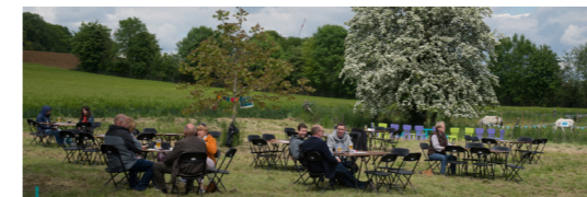
Op 12 mei 2019 kwamen zo'n 150 bezoekers de terugkomst van de zwaluwen vieren in Assent.