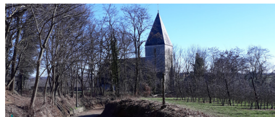
In Bekkevoort bleek dat er veel solitaire bijen nestelen in de zonbeschenen steile wanden van de holle wegen. Daarom werd in 6 holle wegen een deel van het struikgewas gekapt, zodat de bijennesten weer volop in de zon liggen.