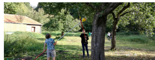
Op het Monfortcollege werd een pluikdag georganiseerd in de boomgaard.