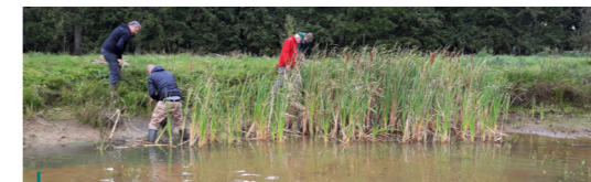
Als afsluitende activiteit van de meerdaagse poelencursus gingen de cursisten zelf aan de slag: samen beheerden ze deze poel.