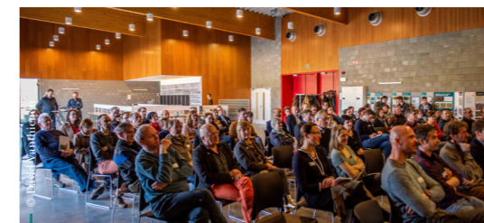
Op dinsdag 19 maart 2019 organiseerde Regionaal Landschap Noord-Hageland voor samen met haar partners een symposium rond 10 jaar Strategisch Project in de Demer- en Laakvallei. We blikten terug op de realisaties op vlak van ruimtelijke ordening, erfgoed en toerisme.