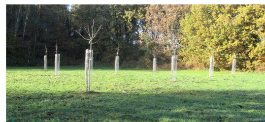
... 161 hoogstamfruitbomen en 43 solitaire bomen aangeplant of hersteld.