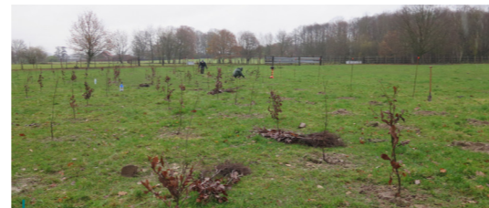
Op deze locatie in Lubbeek plantten we 1,2 hectare nieuw bos aan.

In 2018 maakten we de bospotentiekaart op voor de regio, in 2019 gingen we over tot actie. Met de hulp van de gemeentes werden honderden eigenaars van percelen met een groot potentieel tot bebossen aangeschreven. Uiteindelijk plantten we in 2019 reeds 1,5 hectare nieuw bos aan.