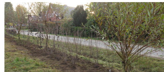
Het voorbije jaar plantte Chiro Jevati alvast een dubbele heg aan.

Chiro Jevati vroeg ons om advies voor hun speelterrein. Het is hun wens om een biodiverse buitenruimte te creëren waar ze met hun leden kunnen ravotten. Wij ontwierpen voor hen een masterplan voor hun terreinen. De inrichting kunnen ze de komende jaren stap voor stap realiseren.