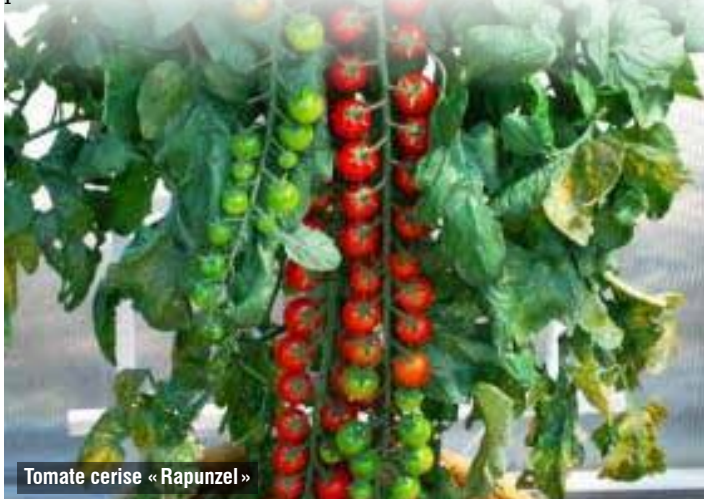
Tomate cerise «Rapunzel»