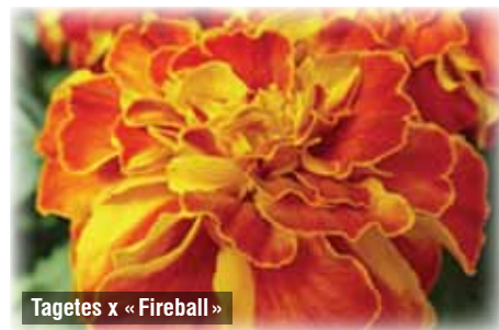
Tagetes x «Fireball»