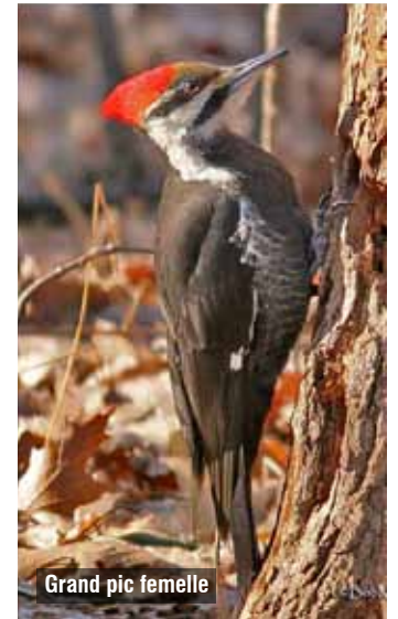
Grand pic femelle

Bref, marcher paisiblement en se laissant envelopper par la cime des arbres, écouter le chant des coyotes au crépuscule, c'est ressentir toute la vraie nature de la Forêt Drummond!