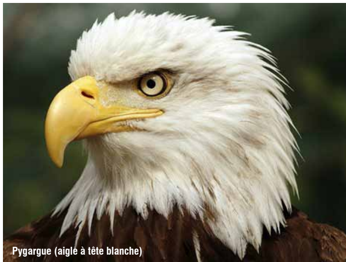
Pygargue (aigle à tête blanche)