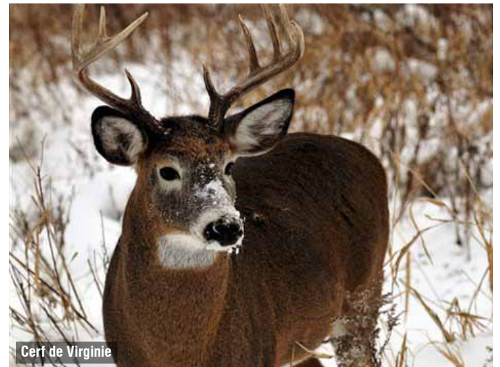
Cerf de Virginie