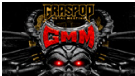
Graspop 21 EUR