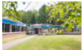
JHB De Roerdomp (Bokrijk) 43 EUR