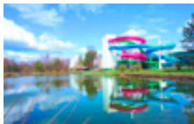
Vakantiepark Molen- heide - 178 EUR/midweek