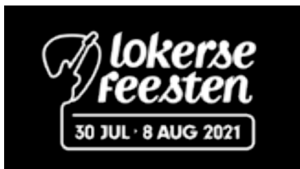
Lokerse Feesten vanaf 7,80 EUR