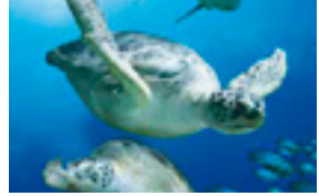
Sealife 10,50 EUR