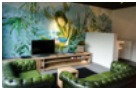
Upstairs hotel 56 EUR/nacht