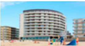
Vayamundo Oostende Appartement vanaf 78 EUR/nacht