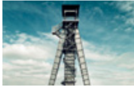
Plopsaland De Panne - 25,90 EUR