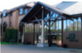
Zorgverblijf Ter Duinen 36 EUR/nacht