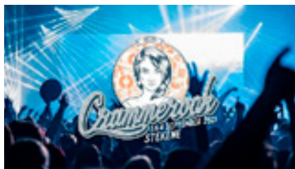
Crammerock 10 EUR