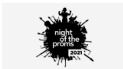
Disney On Ice 7,80 EUR