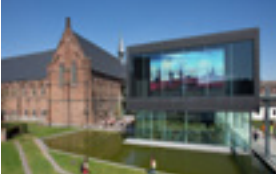
STAM 1,60 EUR