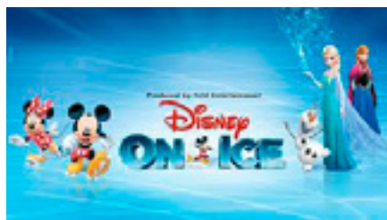
Disney On Ice 7,80 EUR