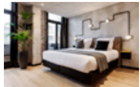
KaBa Hostel 19 EUR