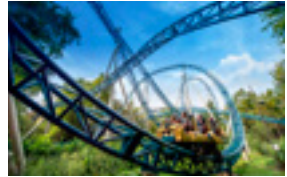
C-mine 3 EUR