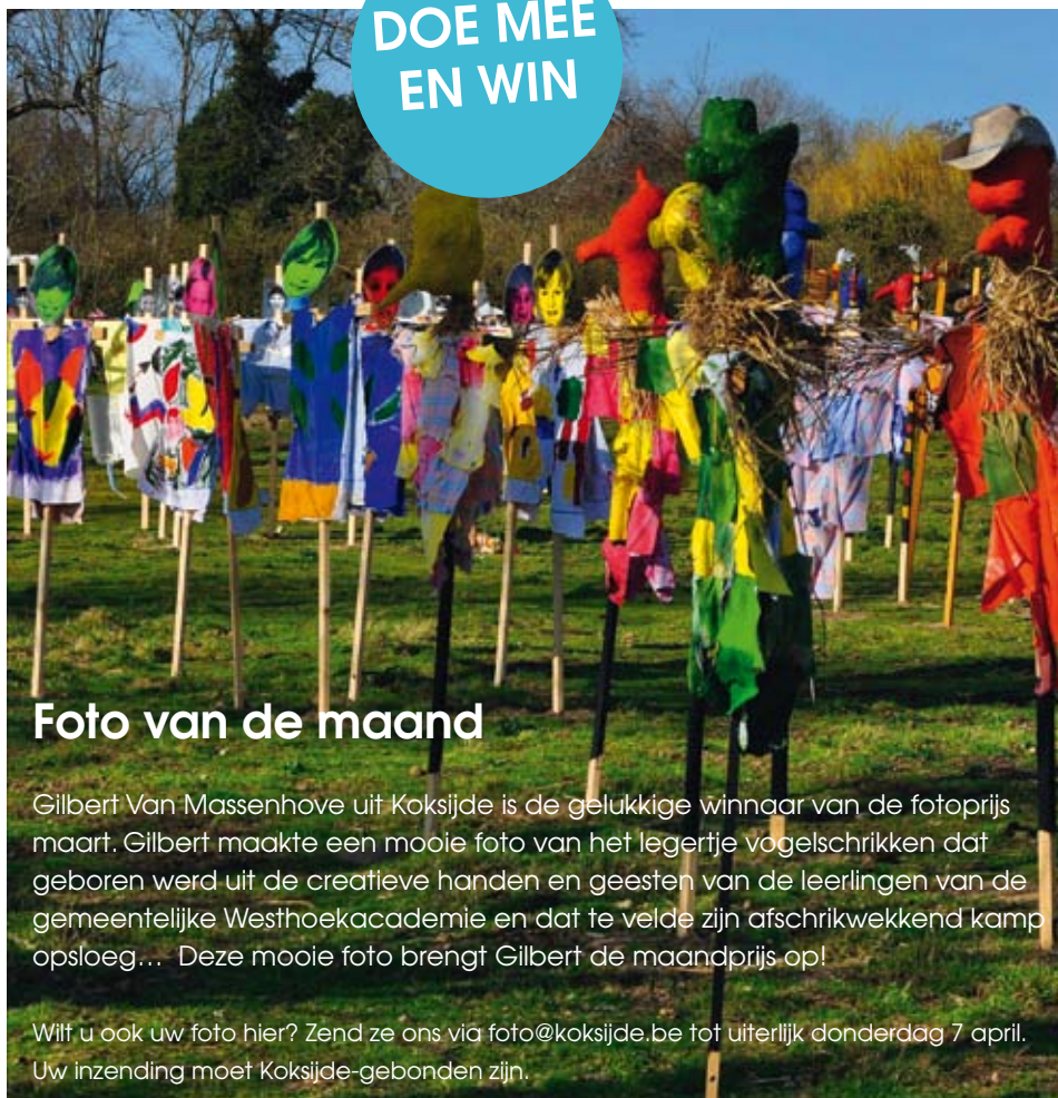
Foto van de maand