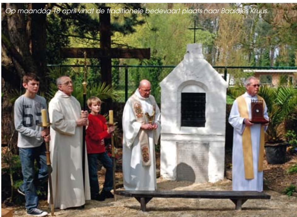
Op maandag 18 april vindt de traditionele bedevaart plaats naar Baaldjes Kruus.

In de oorlogsjaren '40-'45 kende de bedevaart een grote volkstoeloop. Toen Koksijde nog één parochie was, kwamen de bedevaarders samen in de Sint-Pieterskerk. Van daar trokken ze biddend door de duinen naar het kapelletje. In de jaren '70 nam nog slechts een klein aantal gelovigen aan de bedevaart deel. Om de teloorgang van deze traditie te vermijden, werd eind 1993 het Genootschap van de Zalige Idesbald opgericht. Het eerste initiatief werd de viering van de honderdjarige zaligverklaring op 18 april 1994. Sindsdien lijkt de traditie, maar vooral het geloof in de patroon van de vissers, de landbouwers en de Vlaamse adel, lijkt een duurzame toekomst verzekerd.