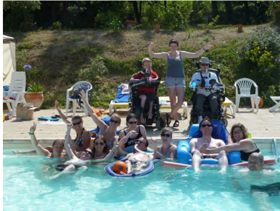
Onze intensive Care