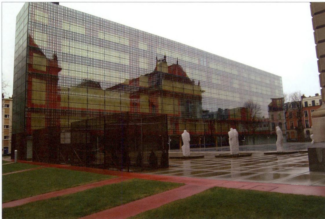
Het Museum van Schone Kunsten in Rijsel weerspiegelt in het nieuwe glazen gebouw in de tuin van het museum