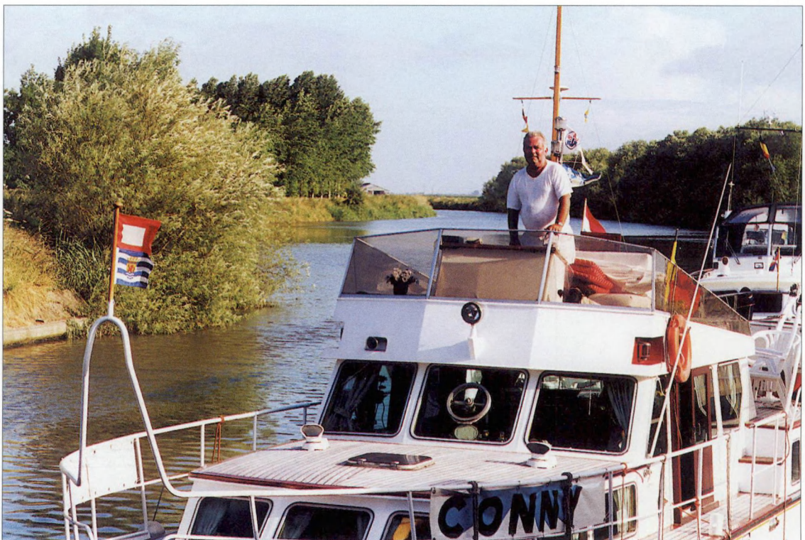
Riviertoerisme op de IJzer