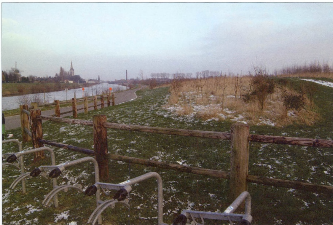
Milieuvriendelijke inrichtingswerken nabij de Leie in Wervik

Om de positie van die grensdorpen en -steden te verbeteren, kunnen enerzijds maatregelen worden genomen om knelpunten weg te werken (nieuwe functies voor douanegebouwen, kwaliteitsverbetering van straatbeeld en publiek domein, geleiding van grensshoppers en terugdringing van de overlast, ...) en anderzijds initiatieven worden ontwikkeld om nieuwe functies op te nemen, vooral dan rond typische (culturele, recreatief/toeristische of commerciële) grensproducten. Een bijzonder fenomeen in dat verband is de Grensleie in Wervik en Menen, met de wens naar bijkomende of nieuwe verbindingen.