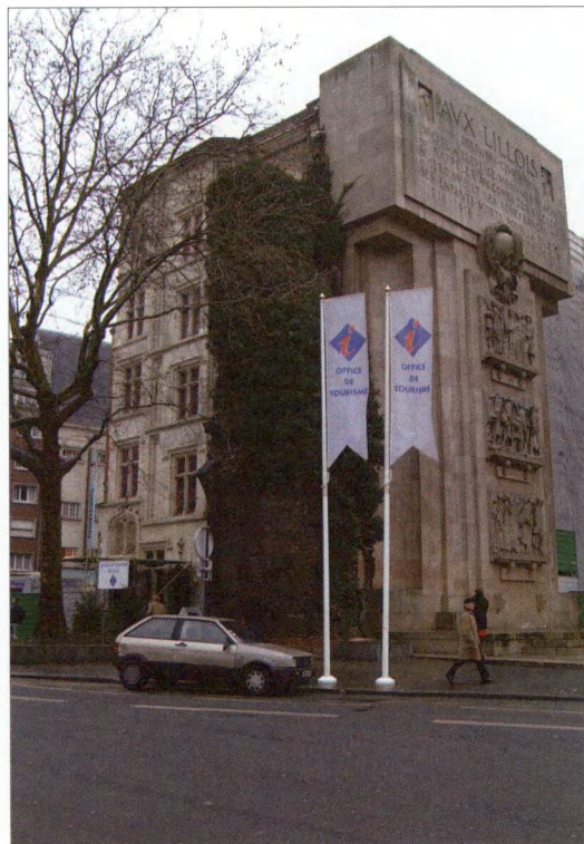
Het toerismebureau van Rijsel