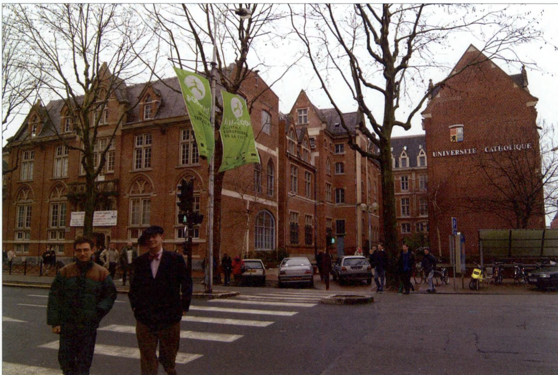
De Katholieke Universiteit in Rijsel

Enkele onderzoekscentra en laboratoria hebben een reputatie opgebouwd die de grenzen van de regio overschrijdt, zoals het Institut Pasteur (geneeskunde), het Institut d'électronique et de micro-électronique du Nord of Technopolis Villeneuve. Maar om op Europees vlak tot een voldoende grote schaal te komen, moet ook de Académie van Rijsel de blik over de grenzen werpen. De oprichting in 1993 van de Pôle universitaire européen de Lille Nord-Pas de Calais betekende een aanzet in die richting.