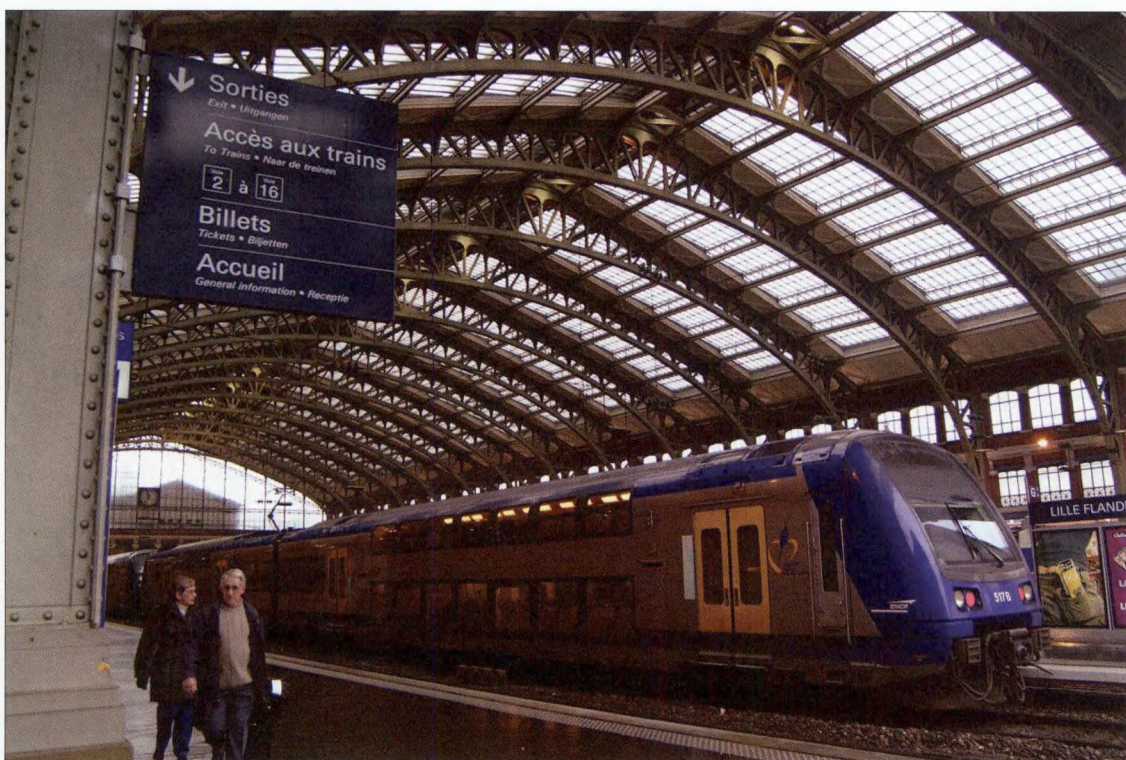
Meertalige borden in het station van Rijsel

De mobiliteit wordt door heel velen in West-Vlaanderen als de prioriteit naar voren geschoven, en dan meer in het bijzonder vlotte en snelle verbindingen vanuit West-Vlaanderen naar de hst-stations in Rijsel. Daarbij wordt dan in de eerste plaats gekeken naar de bestaande treinverbinding Kortrijk-Rijsel, maar er zijn ook de Franse plannen voor een light-railverbinding naar Comines, waar mogelijk vanuit Menen en Ieper aansluiting zou op mogelijk zijn.