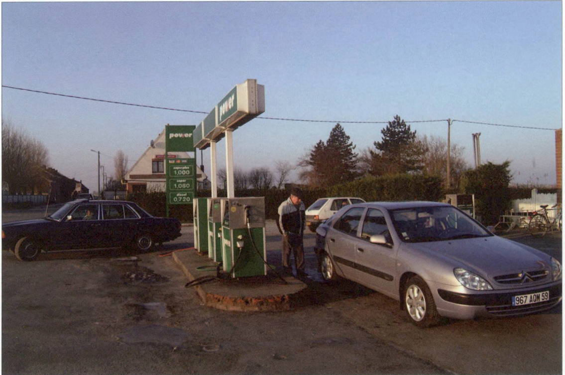
Veel Fransen tanken in West-Vlaamse benzinestations