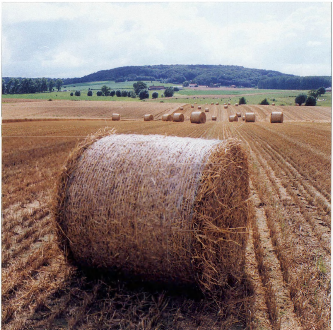
De West-Vlaamse Heuvels: de Kemmelberg

In wat volgt zijn de vier hoofddoelstellingen geconcretiseerd in een aantal deeldoelstellingen. Met de zeven bovengenoemde strategische krachtlijnen in het achterhoofd zijn die deeldoelstellingen verfijnd tot richtlijnen voor acties, met concrete accenten voor de komende jaren.