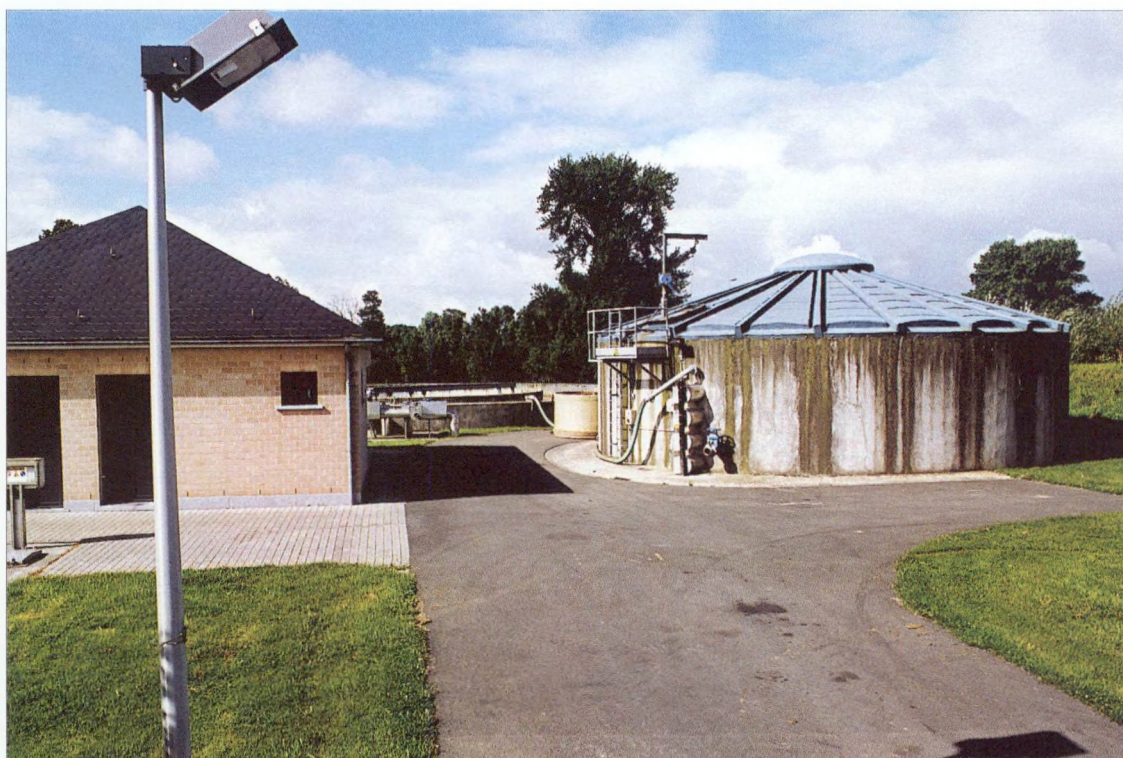
Grensoverschrijdend waterzuiveringsstation in Watou

Om vervolgens op het terrein efficiënt te kunnen werken, is er behoefte aan een grensoverschrijdend juridisch kader op bestuurlijk niveau, zodat er grensoverschrijdende operationele structuren kunnen worden opgezet: „bouwheren” en andere werkingsverbanden die kosten, risico's en opbrengsten kunnen delen, die samen kunnen beslissen om publieke voorzieningen uit te bouwen of te exploiteren, om een dienst te verzekeren of belangrijke evenementen te organiseren. Dergelijke structuren moeten het bij voorbeeld mogelijk maken openbare nutsvoorzieningen zoals zuiveringsstations gezamenlijk te realiseren en te beheren.