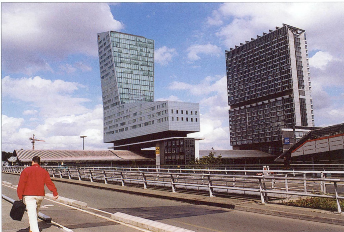
Euralille, het nieuwe Rijsel

Voor Kortrijk en de rest van Zuid-West-Vlaanderen is die metropoolvorming geen proces van ondergaan, maar van participeren. De intercommunales van de arrondissementen Kortrijk (Leiedal), Ieper en Roeselare (WVI) hebben al tien jaar geleden een gemeenschappelijke structuur opgezet met de collega's uit Komen-Moeskroen (I.E.G.), Doornik (IDETA) en Rijsel (Lille Métropole Communauté Urbaine) om de uitbouw van de grensoverschrijdende metropool te bevorderen, de Grensoverschrijdende Permanente Conferentie van Intercommunales (GPCI, COPIT in het Frans).