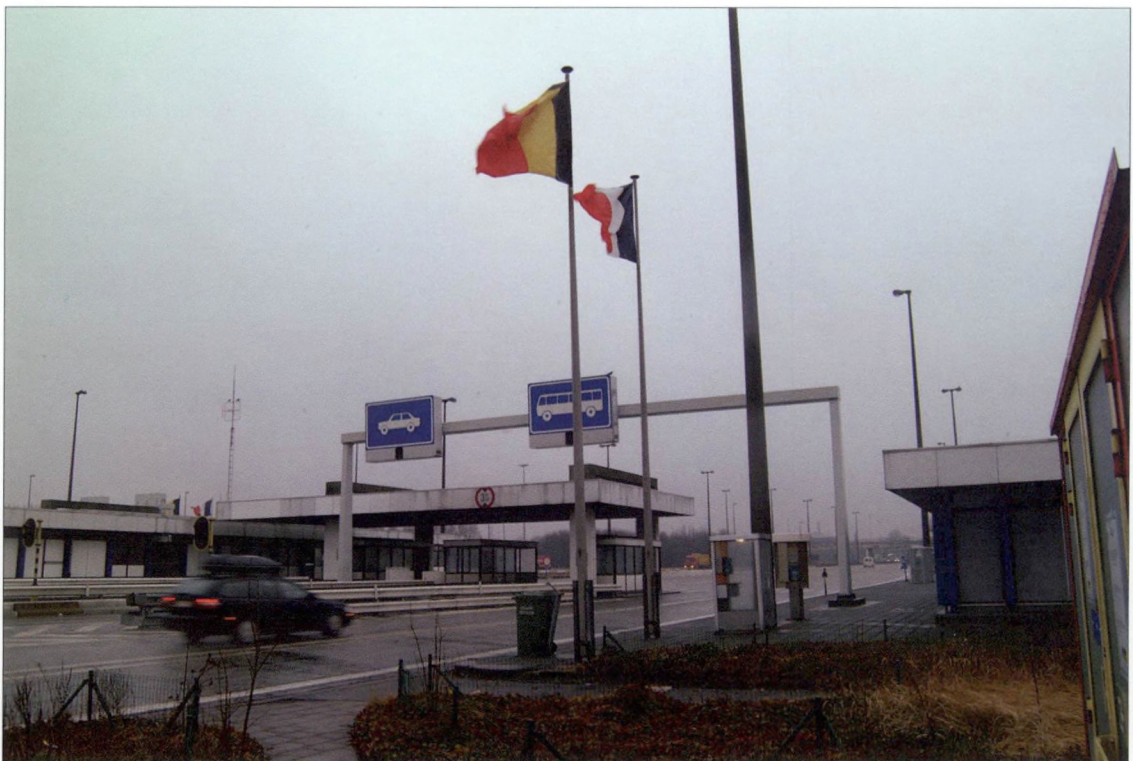
De Frans-Vlaamse grenspost in Rekkem

West-Vlaanderen is binnen België in de eerste plaats bekend als een welvarende provincie met veel kmo's. Alle Belgen komen wel eens naar de Kust en Brugge, maar verder reikt de kennis vaak niet. Uitstraling naar het buitenland is er al helemaal niet, ondanks de bekendheid van Brugge. Die geringe bekendheid dreigt op termijn een ernstige handicap te worden. In de kenniseconomie is er een groeiend verband tussen een aantrekkelijk imago en de economische activiteit en ontwikkeling. Over de economische activiteit zelf hebben we het al gehad, hier belichten we enkele andere aspecten die de uitstraling bepalen.