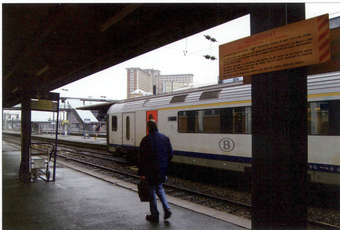
De treinverbinding Kortrijk-Rijsel: aankomst van een Belgische trein in het station van Rijsel