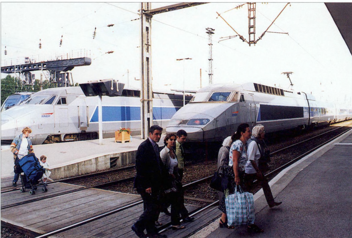
HST-verbindingen in Noord-Frankrijk: station van Duinkerke