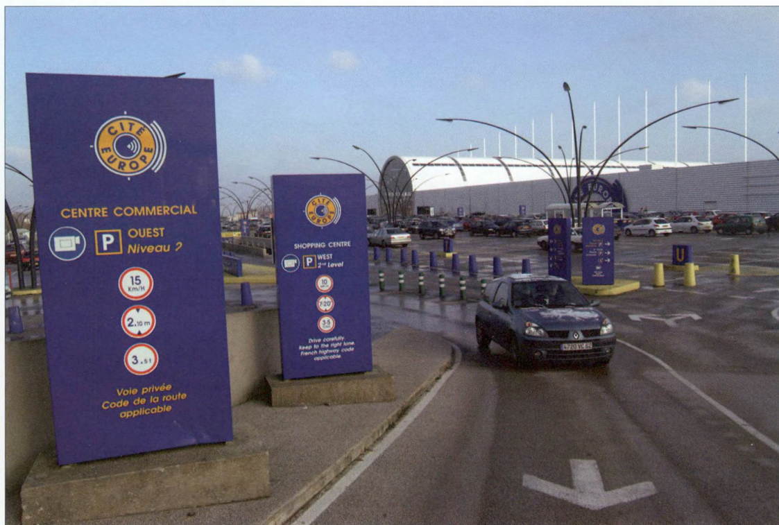
Winkelcentrum in Coquelles

Maar de provincie als bestuurlijke autoriteit kan die ambities niet alleen waarmaken. Daarvoor is medewerking en steun nodig van andere partners (onderwijsinstellingen, culturele verenigingen, socio-economische belangengroepen etc.) en van andere overheden. De ontwikkeling van een beleidsvisie vanuit West-Vlaanderen is dan ook maar een stap naar een visievorming vanuit heel Vlaanderen, om ten slotte uit te monden in een grensoverschrijdende visie van Noord-Frankrijk en Vlaanderen samen.