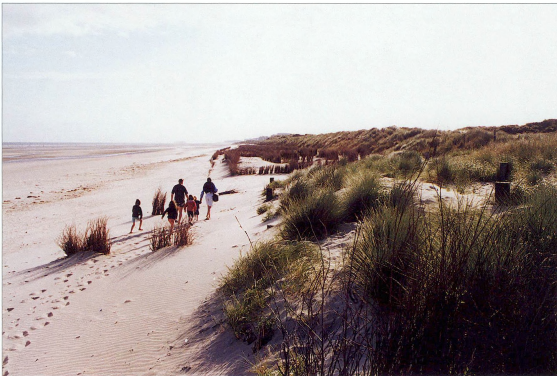
De grensoverschrijdende duinengordel aan de Westkust