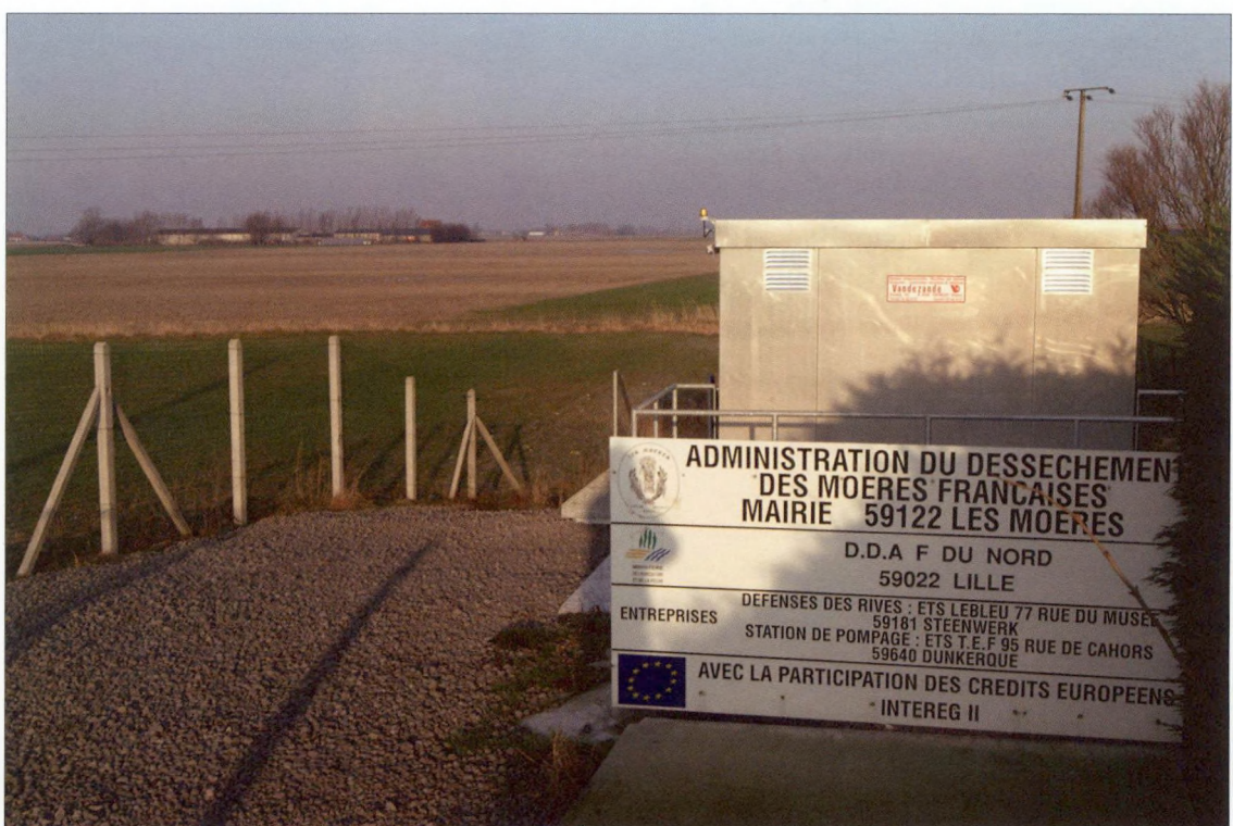
Waterbeheersingsproject in de Franse Moeren

Bij de selectie van projecten is het grensoverschrijdend karakter en het vooruitzicht op een duurzame samenwerking zeer belangrijk. De domeinen waarop kan worden samengewerkt, zijn zeer uitgebreid. Net zoals onder Interreg I en II staat de provincie West-Vlaanderen ook nu weer in voor de coördinatie, het beheer en de administratieve ondersteuning aan Vlaamse kant.