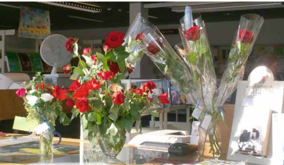
Tevreden gebruikers schenken op Wereldboekendag (in de provincie Antwerpen) een roos en kunnen in ruil een reis naar Barcelona winnen waar dit een traditie is.

veranderingen op de werkvloer hebben. Kennisdelen en ervaringsuitwisseling zijn bovendien essentiële onderdelen van WINOB-projecten. Delphi is als traject bijvoorbeeld een opeenvolging van workshops met intervisiementen, opleidingen, werkgroepen met als doel de bibliotheek om te vormen naar een vraaggerichte werking.