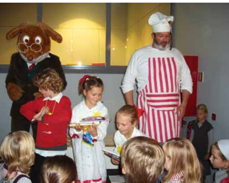
Leespromotie met Geronimo Stilton in de provincie Limburg.

De provincie Limburg biedt bijvoorbeeld een erg intensieve begeleiding aan en werkt hiervoor al enkele jaren samen met de Provinciale Hogeschool Limburg: