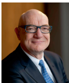
Uw burgemeester Marc Doutreluingne

Een volledig en geactualiseerd overzicht van het bruisend verenigingsleven, handelszaken, vrije beroepen, onderneming, land- en tuinbouw, enz. zal u in de loop van 2014 worden aangeboden.